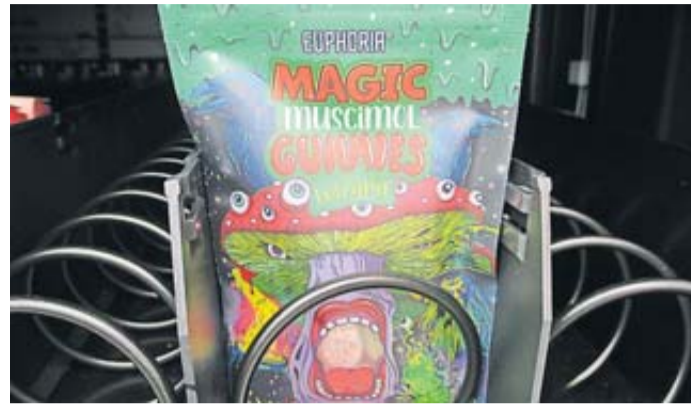
Die bunte Verpackung enthält Gummibärchen mit dem Fliegenpilzgiftstoff Muscimol.

Ein junger Mann kauft an einem Verkaufsautomaten, wie sie derzeit auch im Wetteraukreis vielfach aus dem Boden sprießen, eine Packung Gummibärchen. Kurz nach dem Verzehr muss er mit Vergiftungserscheinungen ins Krankenhaus gebracht werden.