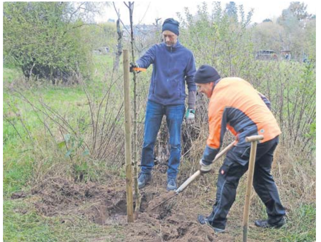
Der NABU fördert den Erhalt von Streuobstwiesen.

Obstbaum-Pflanzaktion des NABU in Bad Nauheim