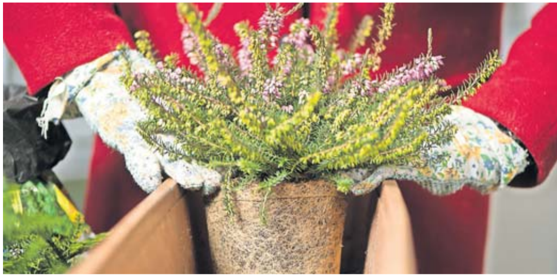
Winterharte Pflanzen wie Winterheide, Scheinbeere und Efeu halten Balkone auch in der kühlen Jahreszeit lebendig.

Der Herbst muss nicht das Ende eines grünen Balkons bis zum nächsten Frühjahr bedeuten. Einem Blumenbüro zufolge gibt es Pflanzen, die sich auch bei herbstlichen Temperaturen auf Balkonen wohlfühlen: Winterastern etwa ( Chrysanthemum hortorum ), Winterheide ( Erica carnea ) oder Scheinbeere ( Gaultheria ). Außerdem: Stechpalmen ( Ilex ) und fluffiges Lampenputzergras ( Pennisetum ). Und auch einen Kräutergarten kann man in der kühlen Jahreszeit noch auf dem Balkon pflegen – wenn man auf winterharte