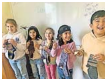
Einige Kinder der DRK Hausaufgabenbetreuung.

Münzenberg. Die Hausaufgabenbetreuung des Deutschen Roten Kreuzes (DRK) in Münzenberg steht vor einer finanziellen Herausforderung. Seit vielen Jahren wird dieses wichtige soziale Angebot durch Einnahmen aus der DRK-Kleidersammlung finanziert. Aufgrund eines weltweiten Einbruchs im Kleidermarkt hat sich das Einkommen aus den Kleidersammlungen jedoch auf etwa ein Drittel des bisherigen Betrags reduziert. Zudem haben die Verwerter der gesammelten Kleidung ihr Zahlungsziel auf drei Monate verlängert, was die Liquiditätssituation des DRK zusätzlich belastet.