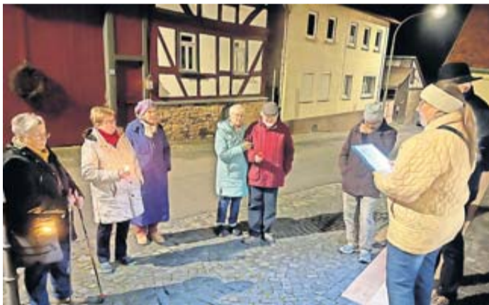
Die Rundgangteilnehmer in den Straßen von Burgenstadt.