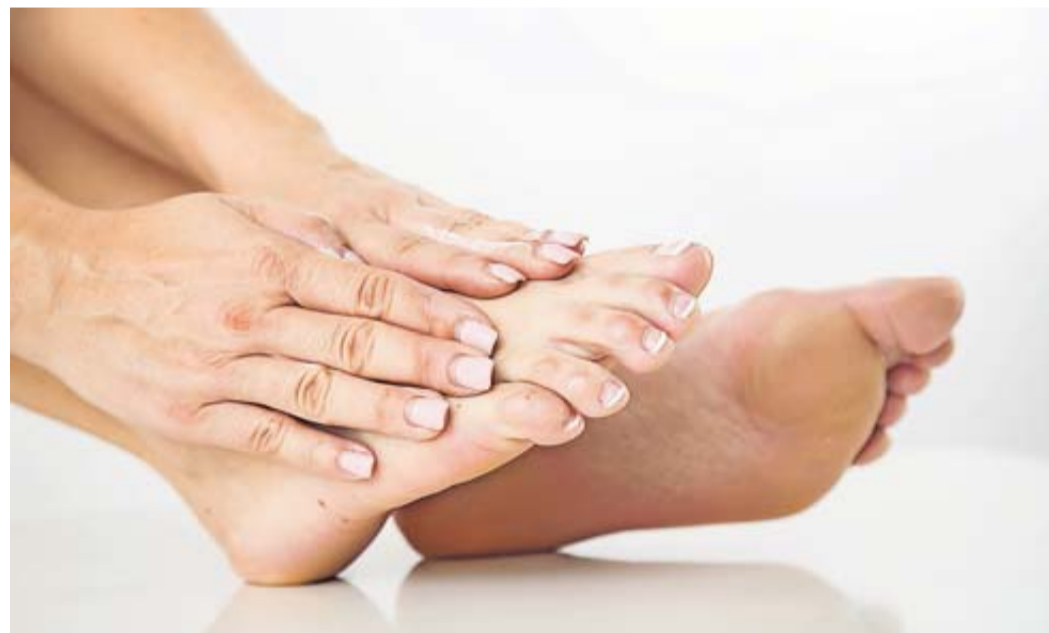
Unsere Füße tragen uns durchs Leben und verdienen etwas Pflege.

Während wir im Sommer noch barfuß im Garten oder am Strand unterwegs waren, stecken unsere Füße jetzt im Herbst wieder in geschlossenen Stiefeletten, Sneakern und Schnürschuhen. Und darin ist es manchmal ziemlich eng. Das kann auf Dauer Folgen haben: Tragen wir zu enge Schuhe, drohen dem Orthopäden zufolge Beschwerden wie ein Spreizfuß oder Nervenschmerzen. Gerade lange Strecken sollten wir daher in ein Schuhwerk laufen, das unseren Zehen genug Bewegungsfreiheit gibt. Auch wenn die Barfuß-Saison längst vorbei ist: Den Füßen tut es gut, wenn wir mal «unten ohne» unterwegs sind, denn das trainiert die Muskeln der Fußsohle. Und wenn es nur zu Hause ist, wo wir zur Abwechslung die Pantoffeln in der Garderobe stehen lassen, um barfuß über Parkett oder Teppich zu laufen. Das fördert Schneider zufolge eine gesunde Zehenstellung.