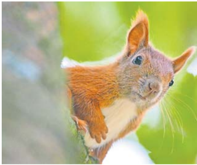
Eichhörnchen sind im Herbst aktiv auf Futtersuche: Um den Tieren zu helfen, können Eicheln, Nüsse und andere Waldfrüchte gesammelt und bereitgestellt werden.