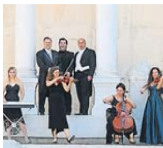
Drei himmlische Opernsänger präsentieren Perlen der klassischen Musik unter Begleitung eines Streichensembels.

aller Welt. Die Zuschauer erwartet eine eindrucksvolle Auswahl von Arien wie „E lucevan le stelle“ und „Domanda al ciel...“ aus Opern wie „Tosca“, „Rigoletto“ und „Don Carlos“, sowie bewegende Stücke wie „Agnus Dei“, „Ave Maria“ und „Panis angelicus“. Ein besonderes Highlight wird zweifellos auch „Nessun Dorma“ sein, ein Stück, das durch die Interpretation von Paul Potts einem breiten Publikum vertraut ist und eine Brücke zwischen Jung und Alt, Klassik