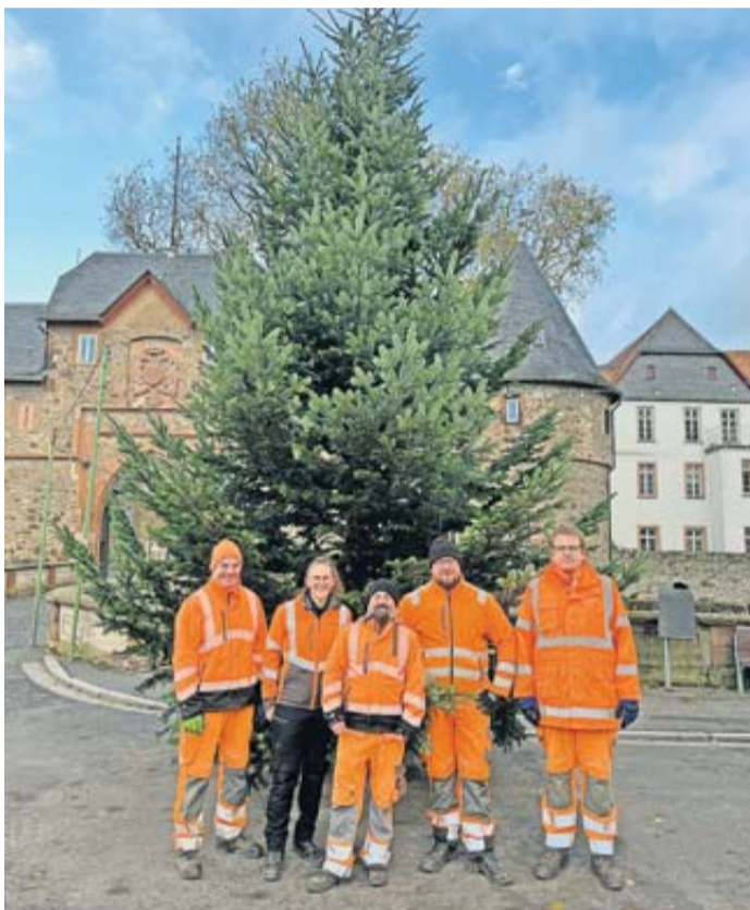
Sechs Personen und ein Bagger waren nötig, um den Baum aufzustellen.

Friedberg. In der schönsten Jahreszeit wird die Innenstadt in funkelnden Lichtern erstrahlen und sicher nicht nur