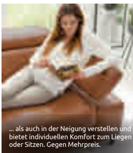
... als auch in der Neigung verstellen und bietet individuellen Komfort zum Liegen oder Sitzen. Gegen Mehrpreis.