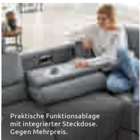
Praktische Funktionsablage mit integrierter Steckdose. Gegen Mehrpreis.