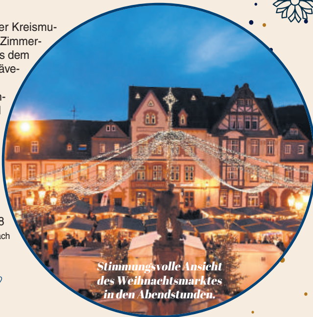
Stimmungsvolle Ansicht des Weihnachtsmarktes in den Abendstunden.