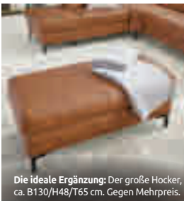
Die ideale Ergänzung: Der große Hocker, ca. B130/H48/T65 cm. Gegen Mehrpreis.

Interliving Sofa Serie 4060 - Eckkombination , Bezug Leder Torro sunset, Metallfuß schwarz, best. aus: 1,5-Sitzer mit Anstellhocker links, Rundecke und 2,5-Sitzer mit Armteil rechts. Inkl. Kopfteilverstellung an allen Elementen. Schenkelmaß ca. 250x285 cm. Ohne Zierkissen und Decke.