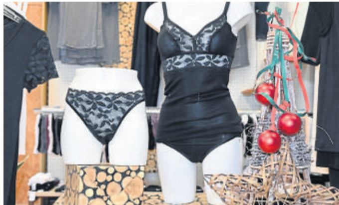
Blick auf schöne Wäsche mit Spitze.

Kontakt: HERMKO, Marktstraße 6, 35781 Weilburg, Telefon 06471-2195, www.hermko.de.