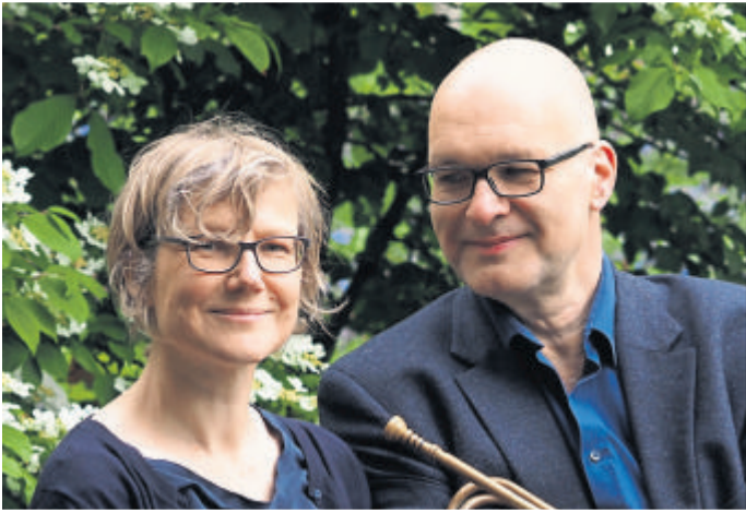
Ensemble Tromba antiqua.