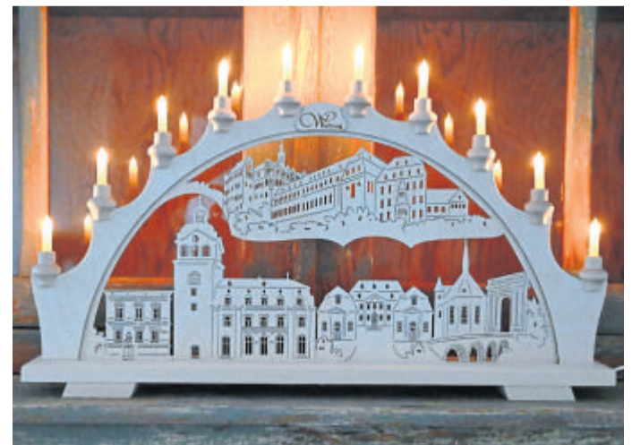
Der prächtige, neue Weilburger Schwibbogen.