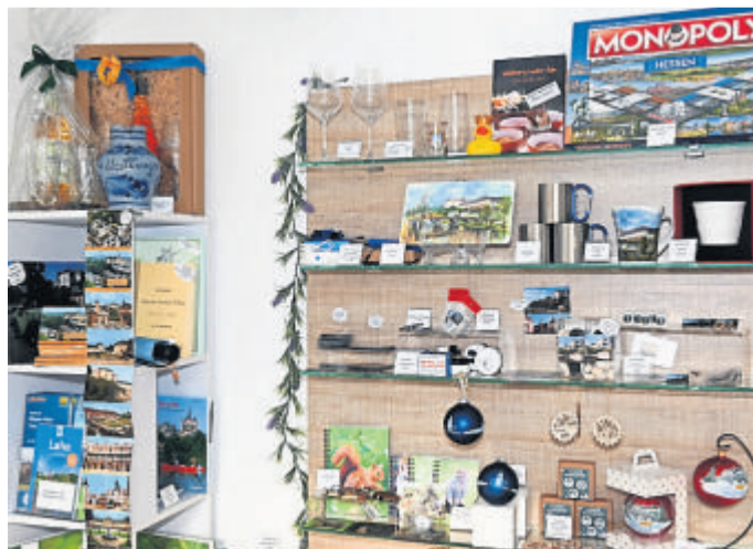
Blick auf einen Teil der vielen Geschenk-Ideen.

Kontakt: Stadt Weilburg, Tourismus- und Wirtschaftsförderung, Marktplatz 3, 35781 Weilburg, Telefon 06471-31467, www.weilburg.de .