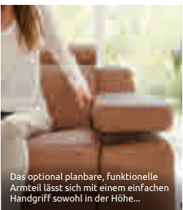
Das optional planbare, funktionelle Armteil lässt sich mit einem einfachen Handgriff sowohl in der Höhe...