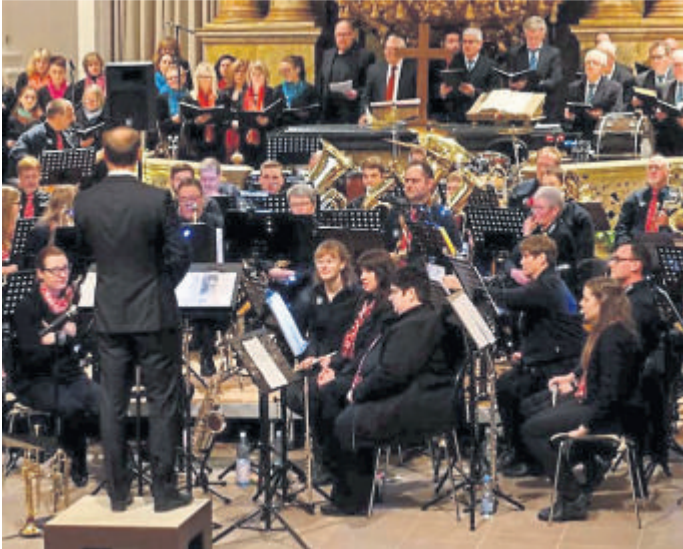
Das Blasorchester der Chor- und Musikgemeinschaft Laubus- eschbach.

Einlass ist ab 19 Uhr. Der Eintritt ist frei, um Spenden für die Tafel wird gebeten.