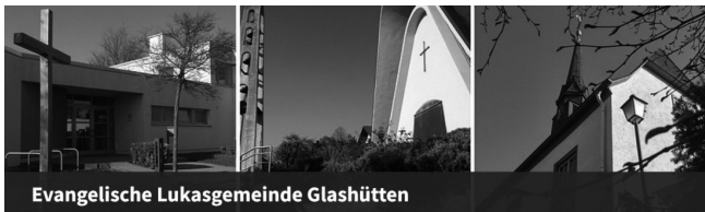
Evangelische Lukasgemeinde Glashütten