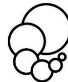
Kulturkreis Glashütten e. V.