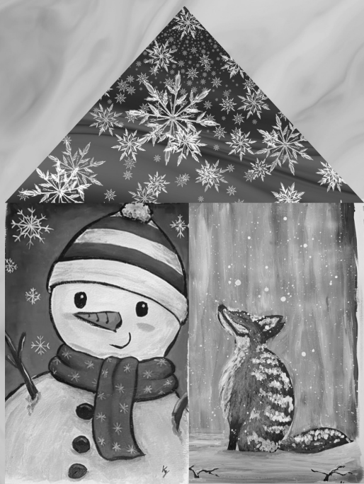
Motiv bei Kinder Veranstaltung