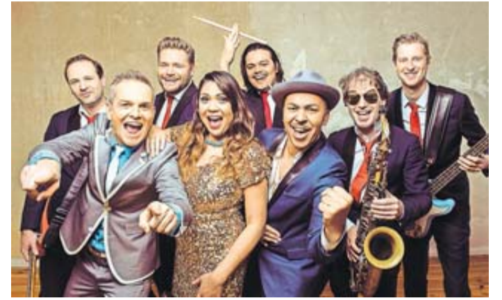
Partystimmung mit der Hermes House Band.

Am Freitagabend starten wir mit einem Hauch von Alpenromantik! Die österreichische