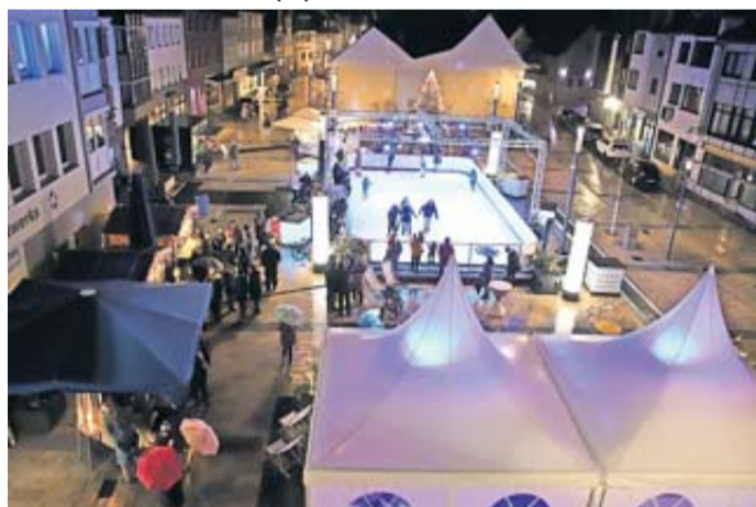
Ein einmaliges Ambiente bietet die Anlage im Herzen der Stadt.

Wie bei einem kleinen Weihnachtsmarkt bieten zwei heimische Gastronomen leckeres Essen und Trinken in Holzhütten an. So verwöhnt das Eiscafé Ciao Ciao mit Glühwein, frisch gebackenen Waffeln und süßen Leckereien. Wer es lieber herzhaft mag, wird bei Slümaika fün-