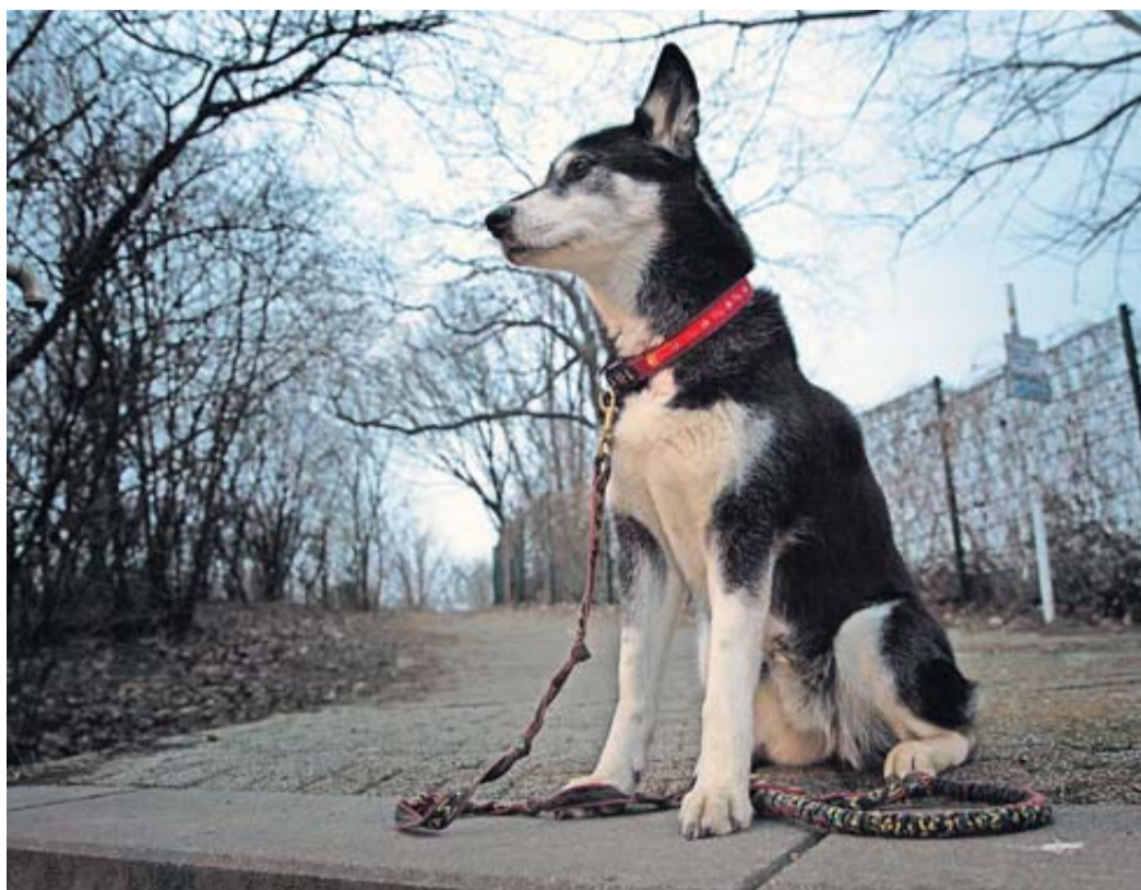
Ein leuchtendes Halsband kann dafür sorgen, dass man Hunde bei Dunkelheit besser sieht.