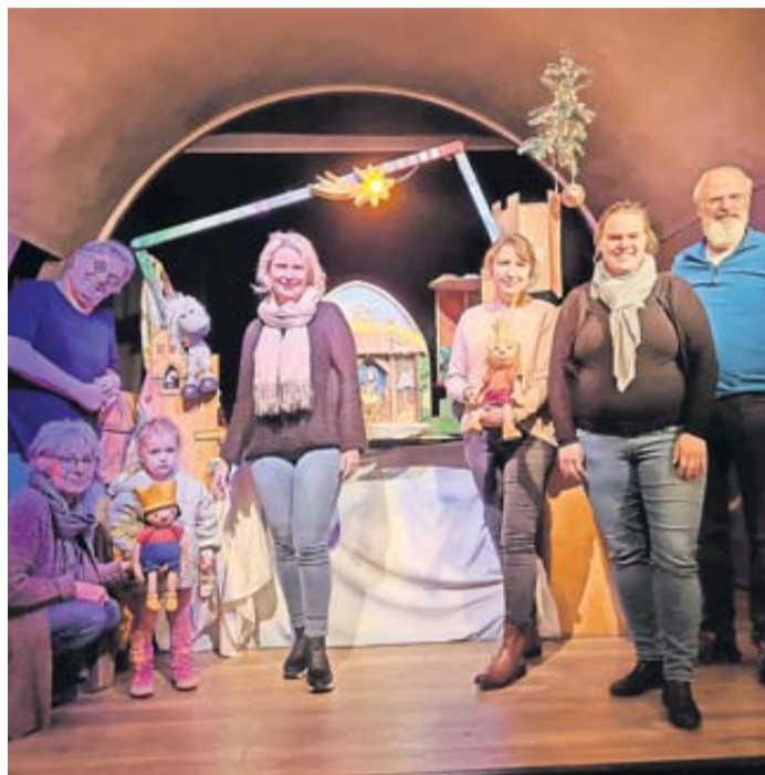
Magischer Nachmittag im Theatrium Steinau.

Schon zu Beginn der Veranstaltung sorgte ein ganz besonderer Gast für leuchtende Kinderaugen: