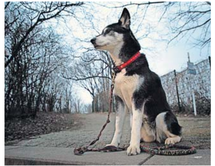
Ein leuchtendes Halsband kann dafür sorgen, dass man Hunde bei Dunkelheit besser sieht.

Im Straßenverkehr können Reflektoren dafür sorgen, dass Hunde besser wahrgenommen werden. Wer seinem Vierbeiner keinen reflektierenden Hundemantel anziehen will, kann sich eine Leine mit Reflektoren oder