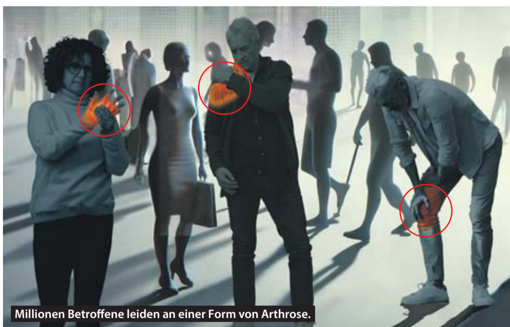
Millionen Betroffene leiden an einer Form von Arthrose.

Zunächst fällt es schwer, das Knie ganz durchzudrücken. Knack- und Reibegeräusche werden hörbar. Treppensteigen verursacht Schmerzen, die sich unter Belastung langsam steigern, aber auch plötzlich einschießen