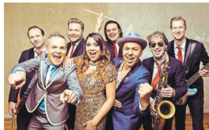
Partystimmung mit der Hermes House Band.

Am Freitagabend starten wir mit einem Hauch von Alpenromantik! Die österreichische