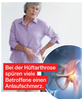
Bei der Hüftarthrose spüren viele Betroffene einen Anlaufschmerz.

Erste Anzeichen sind eingeschränkte Beweglichkeit und Schmerzen in der Leiste und im Gesäß. Mit fortschreitender Erkrankung beginnen die Betroffenen zu hinken, um das schmerzende Gelenk zu entlasten. Die Schmerzen machen einfache Handlungen wie das Binden von Schuhen zu einer Herausforderung.