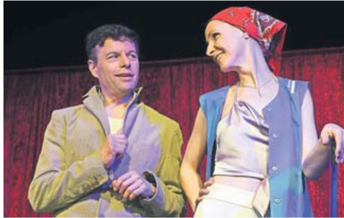
Komödie mit Musik: „Abends in der Firma“.

Am Donnerstag, den 23. Januar gibt es beste Unterhaltung bei der Komödie mit Musik namens „Abends in der Firma“. Der in die Jahre gekommene Juniorchef einer Firma und Elfriede, die Putzfrau, treffen eines Abends im Firmengebäude aufeinander und sind gezwungen, den Abend miteinander zu verbringen. Bei dieser pointenreichen Begegnung werden nicht nur einige Machen-