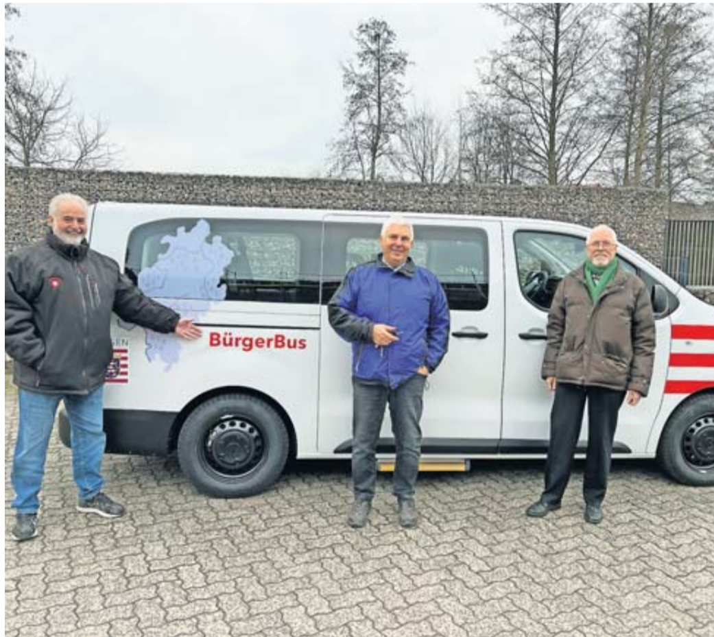
Rosbachs Bürgerbus: Gemeinsam für mehr Mobilität und Zusammenhalt.