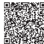
für Banking App