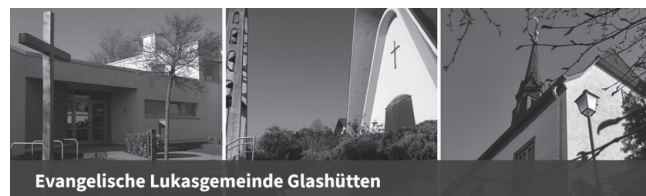
Evangelische Lukasgemeinde Glashütten