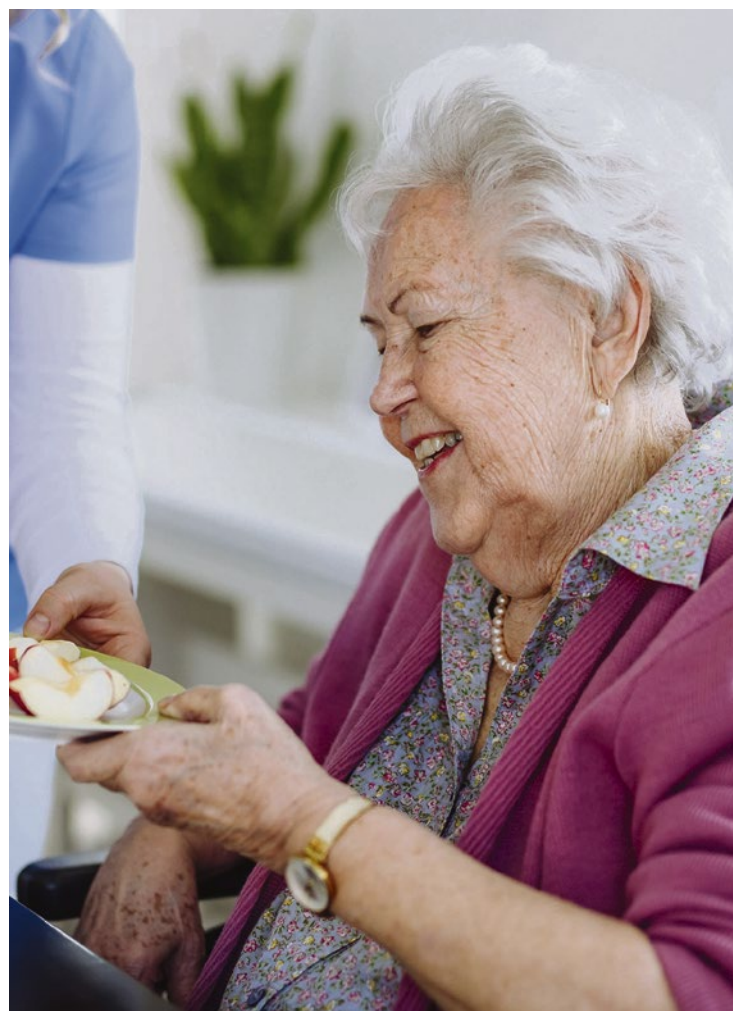
Apfelstücke sind ein gesunder Snack für Senioren. Sie tragen zur notwendigen Versorgung mit Vitaminen und Nährstoffen bei.

Weitere kritische Nährstoffe sind beispielsweise Eisen, Zink und Selen. Fakt ist, dass eine Nährstoff-Unterversorgung gravierende Auswirkung auf die Mobilität, die kognitive Leistungsfähigkeit und die Lebensqualität der Senioren haben kann. Unter www.nahrungsergaenzungsmittel.org gibt es dazu weitere Informationen. Es lohnt sich also, genauer hinzuschauen, um Versorgungslücken festzustellen und eine ausreichende Versorgung sicherzustellen. Dabei kann eine gezielte Ergänzung der täglichen Ernährung mit ausgewählten Nährstoffen die Versorgung der Pflegebedürftigen verbessern.