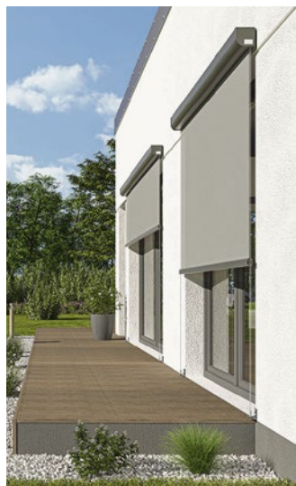
Textile Senkrechtmarkisen können bündig in Fensterlaibungen oder - wie hier gezeigt - aufgesetzt vor die Fassade montiert werden.