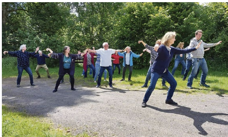
Der Weg ist das Ziel: Mitglieder des Tai Chi Vereins Taunusstein beim Training.