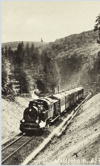
Ein Zug der Langenschwalbacher Bahn, Fahrtrichtung Bad Schwalbach, nahe Waldbahnhof Eiserne Hand. Postkarte um 1930.

Am 15. November 1889 wurde die Langenschwalbacher Bahn, auch Aartal- oder Bäderbahn genannt, in Betrieb genommen. Die Bahnstrecke führte vom ehemaligen Wiesbadener Rheinbahnhof nach Bad Schwalbach, damals noch Langenschwalbach.