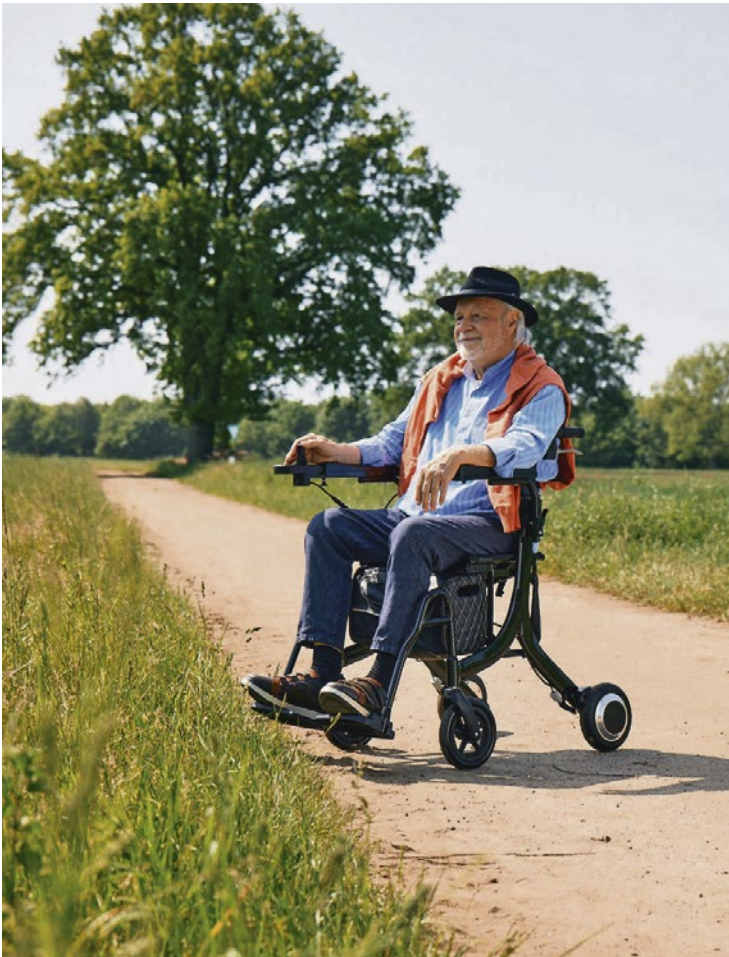
Bei Ermüdung oder schwierigem Untergrund wird der Rollator ruckzuck zum Elektrorollstuhl.

Mit der passenden Gehhilfe zu mehr Mobilität und Selbstbestimmung