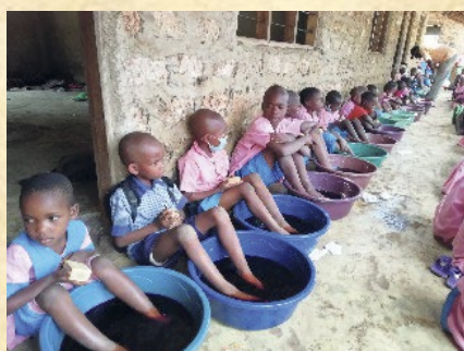
Behandlung an einer der vielen Schulen

Wir haben uns zum Ziel gesetzt, pro Jahr zwischen 15.000 und 20.000 Menschen (überwiegend Kinder) in Kenia von Jiggers zu befreien und ihnen so ein Stück