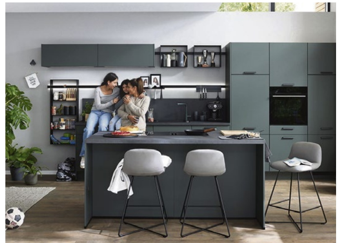
Pur und elegant: Bei dieser mineralgrünen Küche sind Arbeitsplatte, Nischenrückwand und Armatur farblich abgestimmt.

Mehr farbliche Auswahl gibt es in modernen Küchen auch bei Spülen und Armaturen. Neben klassischem Chrom/Edelstahl können sie etwa in Schwarz, Grautönen, Grün oder Kupfer passend zur Einrichtung gewählt werden. "Hoch im Kurs stehen außerdem Armaturen mit Zusatzfunktionen wie Quooker, die je nach Wunsch