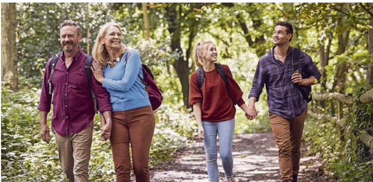
Nach körperlichen Anstrengungen sollten Hörgeräten gründlich von Schweiß und Schmutz gereinigt werden.

Zum Schutz der Geräte raten Experten dazu, ein Stirnband zu tragen und die Hörhilfen nach dem Training zu reinigen. Beim Wassersport sollten sie immer herausgenommen werden.