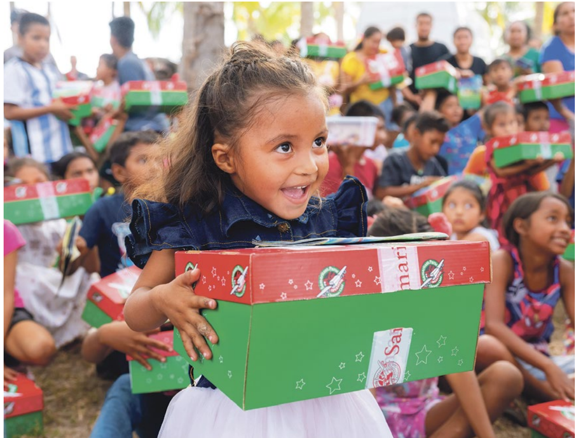
"Weihnachten im Schuhkarton" ist eine internationale Geschenkkaktion und erreicht jährlich Kinder in über 100 Ländern.

Jahr 2023 lagen die Transportkosten pro Karton bereits bei fast 11 Euro. Weihnachten im Schuhkarton ist mit dem bekannten DZI Spendensiegel (Deutsches Zentralinstitut für soziale Fragen) für Seriosität ausgezeichnet worden. Schirmherr dieser Aktion in Taunusstein ist Bürgermeister Joachim Reimann.