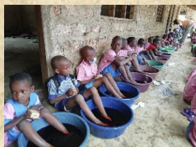
Behandlung an einer der vielen Schulen

Ziel gesetzt, pro Jahr zwischen 15.000 und 20.000 Menschen (überwiegend Kinder) in Kenia von Jiggers zu befreien und ihnen so ein Stück Lebensqualität und vor allem die Möglichkeit zurückzugeben, ihrer lebenswichtigen Arbeit oder dem Besuch der Schule nachgehen zu können. Die Behandlungen führen wir erfolgreich seit 2015 durch. Unser kenianisches Team besucht Dörfer und Schulen, um so großflächig die Menschen auf dem Land zu erreichen zu können. Mit nur € 5,00 kann ein Kind von Jiggers befreit werden. Helfen Sie mit!