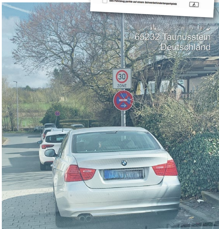
Das neue Online-Formular für Privatanzeigen