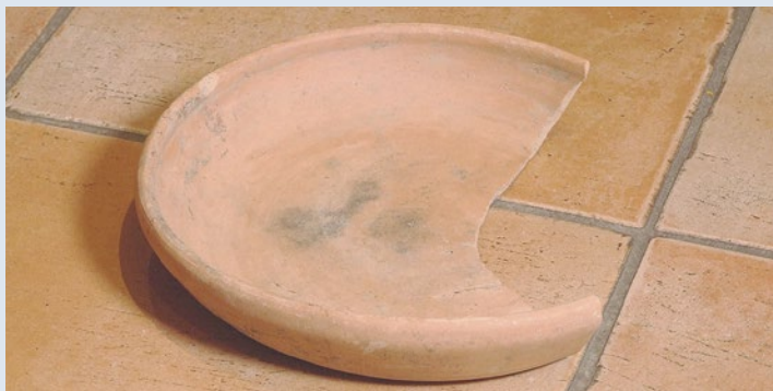
Irdenware, 24 cm im Durchmesser: Der Teller eines römischen Legionärs.