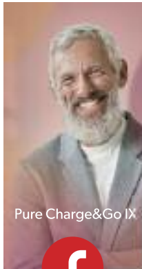
Pure Charge&Go IX