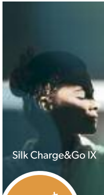
Silk Charge&Go IX