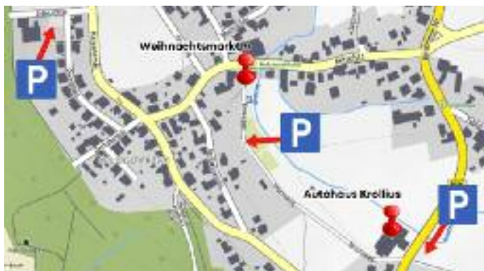
Bild oben: Parkmöglichkeiten zum Brachttaler Familien-Weihnachtsmarkt am 7.12.