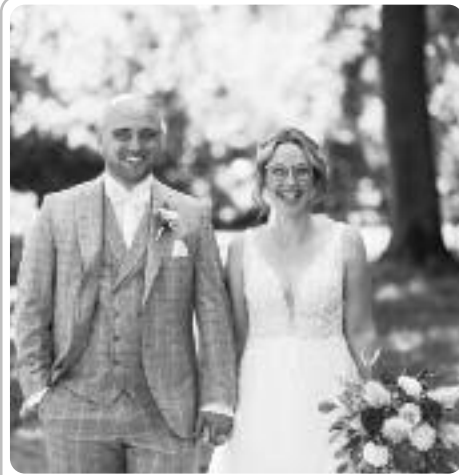
Gunzenau, im September 2024

So viele liebe Worte, so viele Umarmungen.