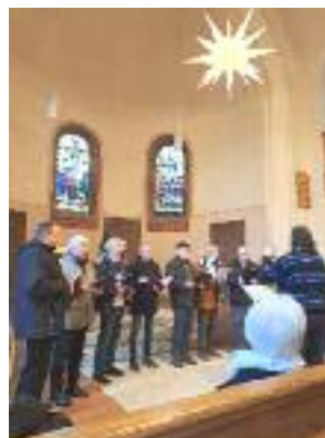
Fotos rechts: Offenes Sing- gen in der Ev. Kirche Bir- stein letzten Sonntag