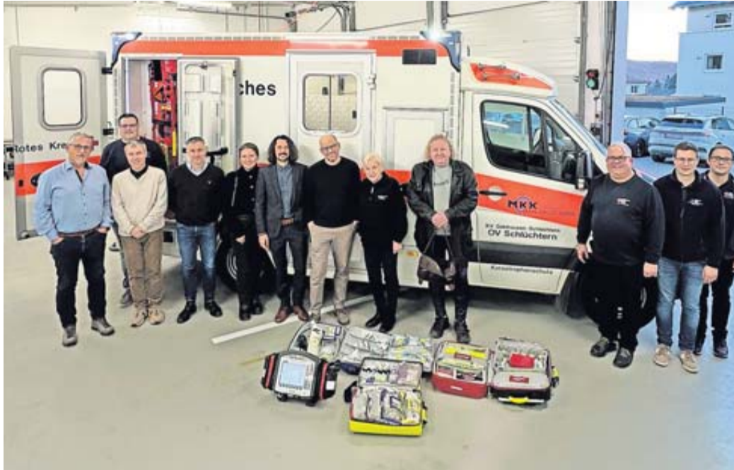
Ein Dankeschön geht an die Spender.