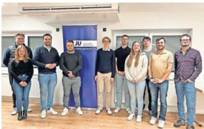
Die Junge Union hatte Jahreshauptversammlung.

Weigand aus Biebergemünd seien beide Verbände wichtige Stützen der Jungen Union Main-Kinzig auf Kreisebene und im Kreisvorstand.