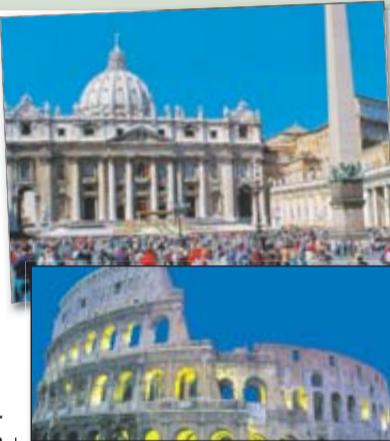
schönen Reise gegen Abend die Heimorte.

6.Tag: Gardasee - Heimreise Nach dem Frühstücksbuffet Beginn der Heimreise. Durch die herrliche Bergwelt Südtirols - Innsbruck - München - Nürnberg - Würzburg erreichen wir nach einer