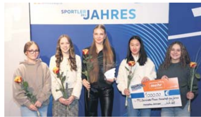
Die Frauen des TTC Salmünster stiegen in einem Herzschlagfinale in die 3. Tischtennis-Bundesliga auf und verdienten sich damit den Titel „Mannschaft des Jahres“.