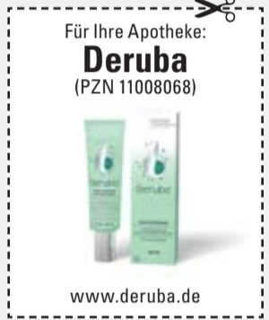
(Abbildung Betroffenen nachempfunden)

Unser Tipp: Eine Spezialcreme mit einzigartigem 3-fach-Effekt (Deruba, Apotheke)! Dank mikroverkapselter Pigmente kaschiert Deruba Gesichtsrötungen sofort. Die spezielle Aktivstoff-Formel mildert sie längerfristig. Der integrierte UV-Schutz mit LSF50+ beugt der Entstehung neuer Rötungen vor. Deruba – die Rundum-Antwort auf Hautrötungen!