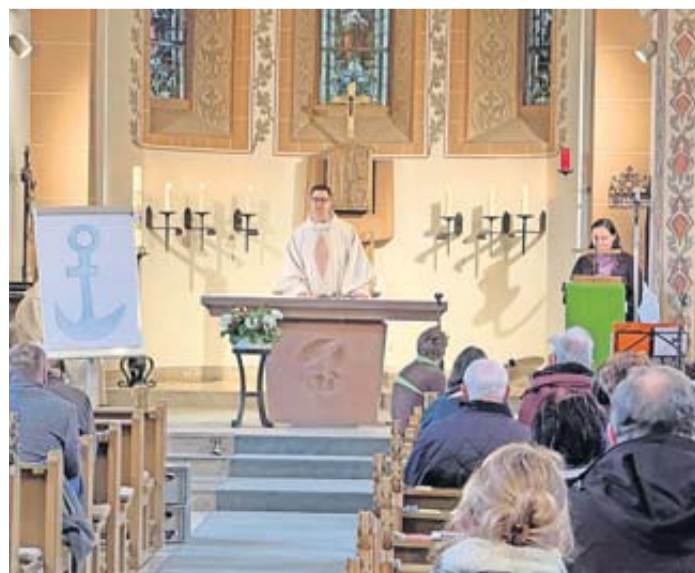
Festgottesdienst mit zahlreichen Gästen.

Nach dem Gottesdienst lud Pater Andreas Kühne die Besucher in die Kantine des Jugendhilfezentrums ein, wo selbstgemachte Spaghetti Bolognese serviert wurden. Im Rahmen des Tags der offenen Tür waren die Wohngruppen Magone und Rinaldi geöffnet. Besucher wurden mit Kaffee, Kuchen, alkoholfreien Cocktails und frischen Waffeln verwöhnt. Die Gruppen Savio und Turin sowie das Team Flexible Hilfen boten deftige und süße Snacks an, während die Gruppen Moglia und Murialdo junge Gäste mit Konsolen- und Geschicklichkeitsspielen unterhielten. Die Besucher waren beeindruckt von der herzlichen Atmosphäre und dem Engagement der Mitarbeiter.