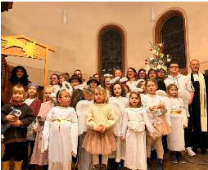
Foto: Gelungenes Krippenspiel zu Weihnachten in der Evang. Kirche Birstein - siehe auch Seite 14

Am Sonntag - 12. Januar 2025 - öffnet das Fürstliche Haus Isenburg seine Pforten: Um 14:00 Uhr wird unsere Gästeführerin Britta Schäfer-Clarke interessierten Besuchern das Schloss, seine Architektur, Geschichte und vieles mehr vorstellen. Gezeigt werden die Empfangshallen, das imposante Treppenhaus, der Kaminsalon und der Kleine Stucksaal in der ersten Etage sowie die prächtigen Säle in der sogenannten Bel-Étage und ... kleine Überraschung. Dauer: 1 Stunde. Anmeldung direkt online auf: https://isenburg.de/veranstaltungstermine