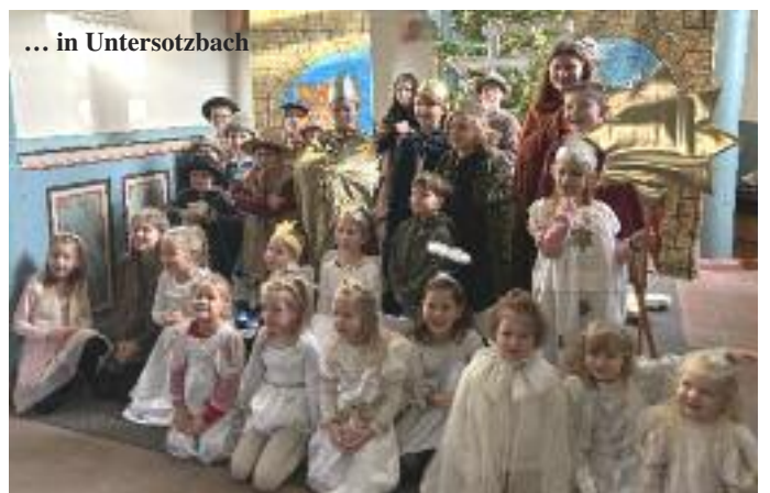
... in Untersotzbach