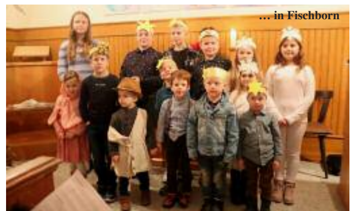
... in Fischborn

Infoveranstaltung 700 Jahre Sotzbach. Am Sonntag, dem 19.01.2025 , von 10.30 bis 11.30 Uhr, berichtet der Förderverein 700 Jahre Sotzbach e.V. im Sitzungsraum in der Alten Schule Obersotzbach, über den aktuellen Stand der Planungsarbeiten zur Jubiläumsfeier in 2026. Dort besteht die Möglichkeit sich über die Arbeit der einzelnen AGs zu informieren, mitzuwirken, um die Durchführung der Jubiläumsfeier, egal in welcher Form, aktiv zu fördern und zu stärken. Wir freuen uns auf Eure Unterstützung.