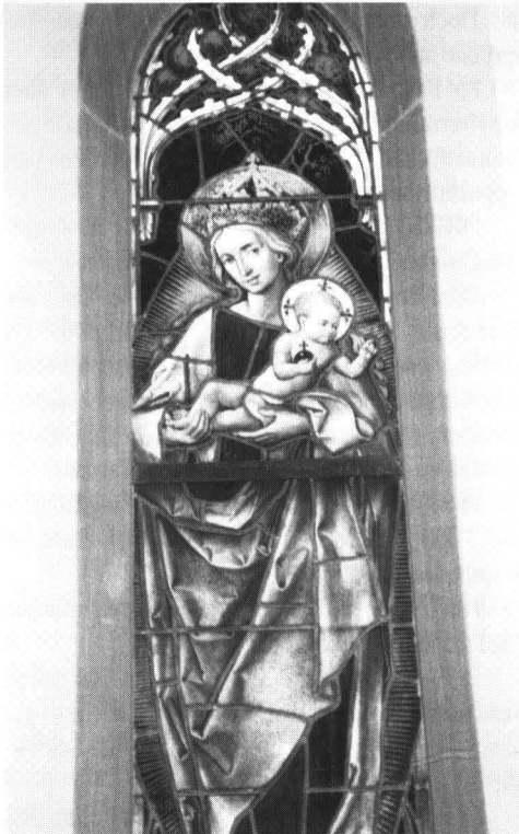
Abb. 5: Glasfenster – Maria mit Kind – in der 1909 – 1912 neu errichteten gotischen Kapelle.

1888 Im Oktober Verkauf an den Witwer Melchior Adolf Pistor in Sachsenhausen.