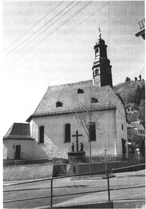
Abb. 4: Dorfkirche von Sauerthal aus dem Jahre 1748.