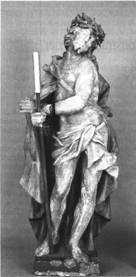
Abb. 3: Der geißelte Heiland im Purpurmantel, ein Rohr in den gefesselten Händen und die Dornenkrone auf dem Haupt von Burkhard Zamels. Ehemals an einem Haus in der Mainzer Kapuzinergasse, heute im Landesmuseum.