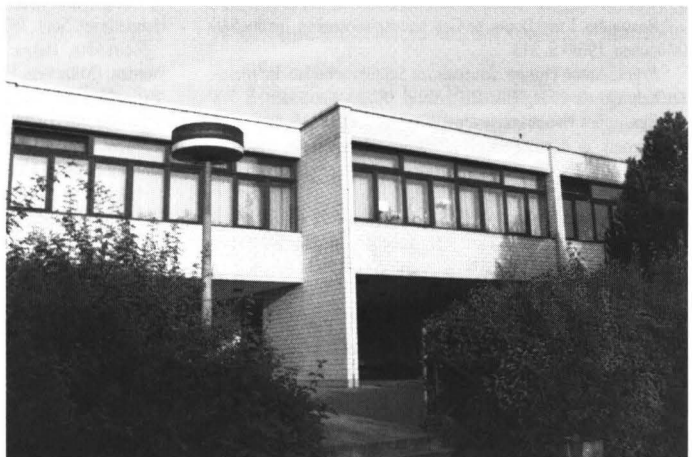
Abb. 4: Die 1971/72 erbaute Hallgartener Grundschule. Ein Weißziegelbau in aufgelockerter Pavillon-Bauweise. (Am nördl. Ortsrand gelegen.)

Voller Stolz konnte Schulleiter Otzipka 1972 über die feierliche Einweihung der neuen Grundschule am Schwimmbad berichten. (Die Genehmigung zum Neubau war in einer äußerst erregten und stürmisch verlaufenen Eltern- und Bürgerversammlung am 5. Oktober 1970 im Gasthaus „Zum Taunus“ dem damaligen hessischen Kultusminister Ludwig von Friedeburg regelrecht abgerungen worden.)