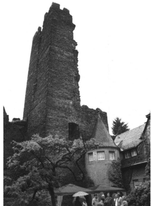
Abb. 2: Der 1689 gesprengte Bergfried der Sauerburg.

1689 Zerstörung der Sauerburg durch ein Sprengkommando der Franzosen. Beim Abzug wurde auch der Bergfried gesprengt.