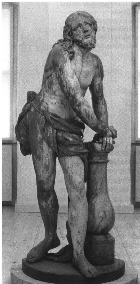
Abb. 2: Jesus an der Geißelsäule von Burkhard Zamels. Abtei-Museum Kloster Eberbach.

Große Ähnlichkeit mit der Eltviller Figur hat auch eine Skulptur von Burkhard Zamels von einem Haus in der Mainzer Kapuzinergasse, die – lange verkannt – erst kürzlich geborgen und untersucht wurde und seit April im Landesmuseum in Mainz zu sehen ist. Auf den Betrachter wirkt sie wie ein spiegelverkehrtes Abbild unseres Eltviller Heilandes. Sie zeigt den Geißelten im Purpurmantel, ein Rohr in den gefesselten Händen und