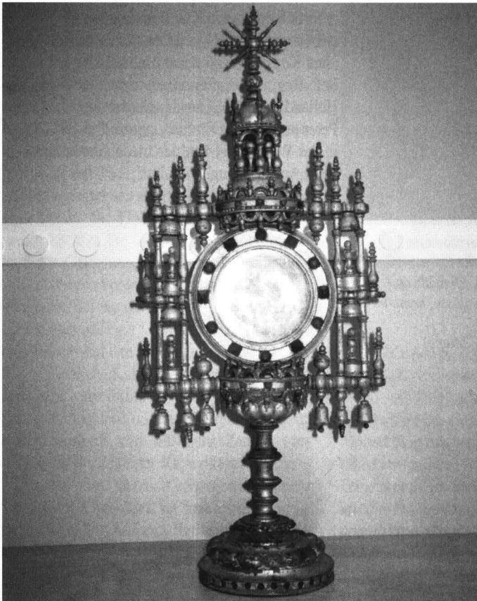
Eberbacher Monstranz von 1641.