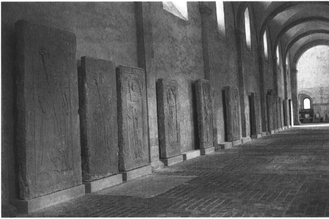
Abb. 3: Im nördlichen Seitenschiff nach Osten am endgültigen Standort bereits aufgestellte Grabplatten.

„Meine Noth dir zu klagen, o Herrgott im Himmel! Entreiß ich ein'n Moment mich dem Arbeitsgetümmel. Ach denk nur, Geliebter! Die Aebte, die Lümmel, Die sind jetzt geworden weißgelblich voll Schimmel!! Wie ist da zu helfen? Du theuerster Mann, Weißt schnell ein Mittel Du, so sag es mir an! Soll ich fegen und krazen mit Bürste und Besen? Doch ach ihre Schönheit, sie wär dann gewesen! Soll ich schmieren und salben, und pinseln und weisen? Soll ich mühsam geflicktes auf einmal abreisen, Um gründlicher weiter zu flicken daran? O helfe und rathe, Du alter Kumpan! Ich grüß Dich. Bleib stets mir gewogen, Und komm bald hierher zu den Aebten gezogen!“