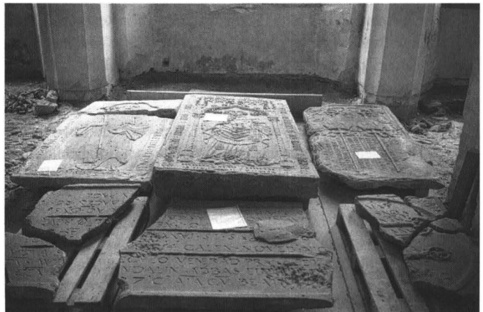
Abb. 1: Im gotischen Kapellenschiff aus dem Boden gehobene Grabplatten.

1936 entschloß man sich – obwohl ein Plan zur Aufstellung der Abtsgrabplatten im nördlichen