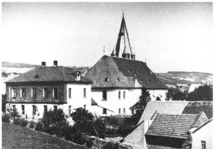
Abb. 2: Neben der Pfarrkirche Mariae Himmelfahrt das 1835 errichtete Schulgebäude. Hier wurde bis 1972 unterrichtet.

„Der Lehrer selbst wird reinlich und anständig gekleidet in der Schule erscheinen, und da ihm eine