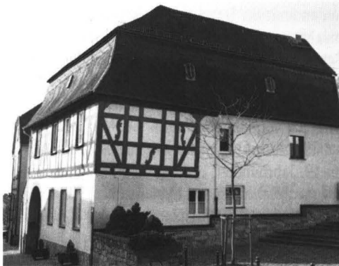
Abb. 1: Zangerstraße 1: Von 1792 bis 1835 Hallgartener Schule, dann Lehrerdienstwohnung.

Am 19.4.1792 verkauften die Schwiegereltern des Lehrers der Gemeinde das „gut gebaute Haus Nr. 21 an der Kirche“, wie der Kaufvertrag belegt, „nach dem Wald hin an den Kirchhof und nach dem Rhein an das Haus Joh. Kremer angrenzend, samt Scheune, Stall, Kelter und Keller für 1215 Gulden als Schulhaus“. 10