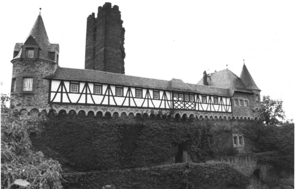
Abb. 1: Die Sauerburg von Südwesten.

1320 Errichtete Kur-Pfalz im Rhein vor Kaub den „Pfalzgrafenstein“ als Zollburg.