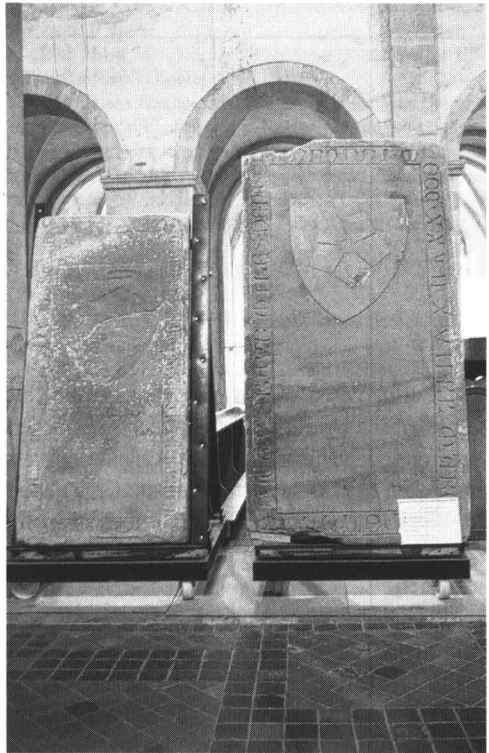
Abb. 2: Zur Aufstellung präparierte Grabplatten auf eigens dafür gefertigten Transportkarren.

Sobald die Harze mit dem Terpentin in mäßiger Wärme geschmolzen sind, so setze man den Kampfer und das Oehl zu. Alsdann schmiert man die Sauce den Kerls ins Gesicht.“