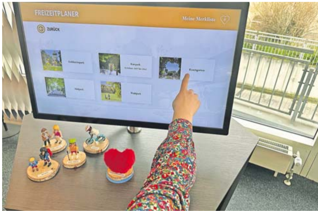
Der Digitale Freizeitplaner ist ab sofort zugänglich und aktiv.

Über einen Sensor kann der Freizeitplaner mit dem Aufstellen der Herzfigur aktiviert werden. Er funktioniert wie eine Merkliste. Nutzer können durch die verschiedenen Kategorien stöbern und sie je nach Bedarf auswählen und speichern. Das Speichern funktioniert ganz einfach über einen Klick auf das jeweilige Herz-Symbol. Die gespeicherten Informationen werden in einer Liste zusammengefasst. Über ei-