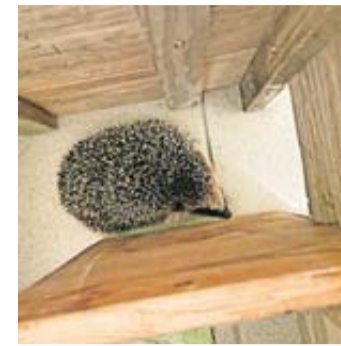
Butzi auf dem Weg der Besserung – dank liebevoller Pflege.

Umso wichtiger ist der Einsatz der ehrenamtlichen Helfer, die in Igelauffangstationen die kleinen Igel wieder aufpäppeln. Auch die Igelmama in Wöllstadt kümmert sich hingebungsvoll um die