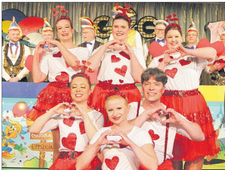
Die Gusbacher „Herzcher“ präsentierten sich mit viel „Amore“ auf der GCC-Bühne.

Dort hatten die „Knallbonbons“ das letzte Wort, bevor es Luftballons regnete. bpa