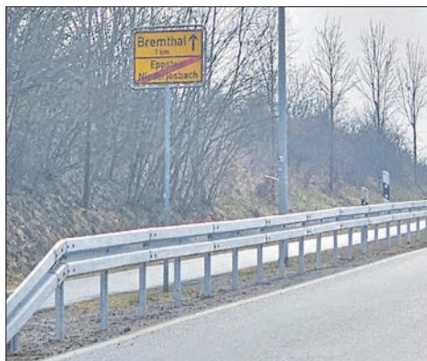
Der Fußweg zwischen Niederjosbach und Bremthal wurde mit einer Leitplanke zur Fahrbahn hin gesichert.