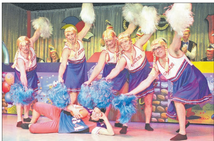
Die „Bobbelscher“, die jüngste Garde des GCC, meisterte ihren ersten Auftritt vor großem Publikum mit Bravour. Das Männerballet „Feinrippschläppcher“ leitete mit seinem Tanz zum Finale über.