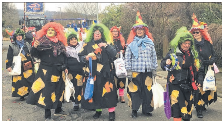
Die Vockenhäuser Hexen feierten beim Umzug in Schloßborn fröhliche Straßenfastnacht.

Nach der Eroberung des Rathaussessels bis Aschermittwoch machten sich die Hexen auf zu ihrer nächsten Etappe: Am Samstag liefen sie beim Umzug durch Schloßborn, der nur alle fünf Jahre gefeiert wird und mit knapp 40 Zugnummern recht stattlich ausfiel. Am Dienstag feierten sie beim Umzug des GCC in Niederjosbach den Abschluss der Fastnacht.