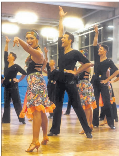
FG Rhein-Main A-Team startet furious in der 2. Bundesliga Süd Latein.

Das Saisonziel ist das Erreichen der Meisterschaft in der zweiten