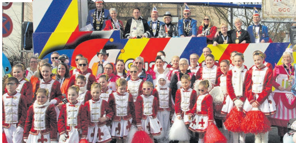
Vor dem Umzug stellten sich die Garden des GCC noch einmal zum Gruppenfoto vor dem neuen Komitee-Wagen in den Vereinsfarben Blau, Gelb, Rot und Weiß auf.