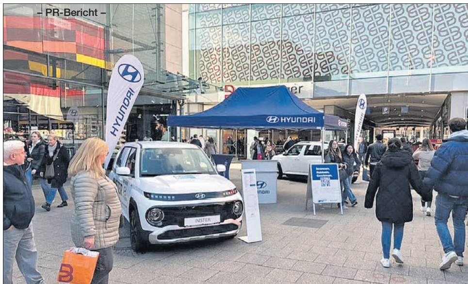
Zwischen Kaufhaus, Sportfachgeschäft und Restaurants im MTZ präsentierte das Bremthaler Autohaus Gottron das neue Kleinwagen-E-Modell von Hyundai.