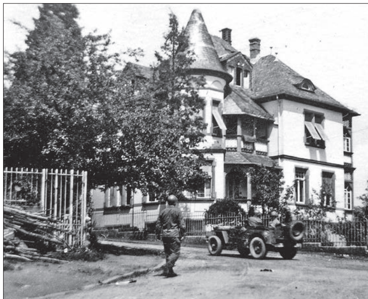
Vom 13. Mai 1945 an waren in der Villa Froelich in der Mendelssohnstraße 17 bis zu 25 amerikanische GIs einquartiert.