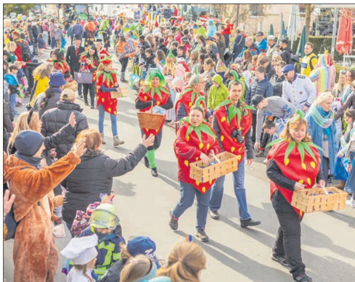
Als leuchtend rote „Erdbärn“ verkleideten sich die Mitglieder des Heimat- und Geschichtsvereins Niederjosbach.