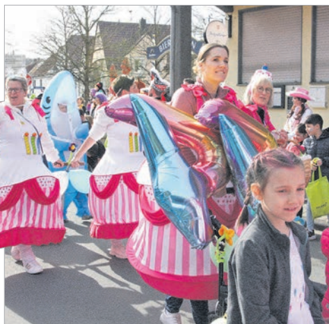
Die „Knaller-Damen“ des GCC waren mit ihren weiß-rosa Torten-Reifröcken ein Hingucker.