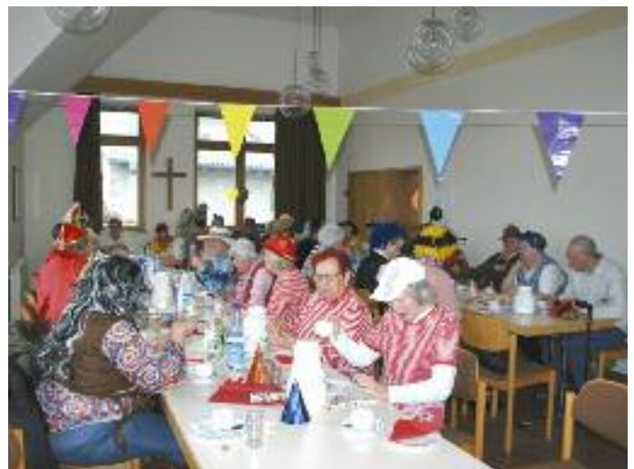
Foto: Bei der Faschingsveranstaltung im Themencafé Udenhain - siehe auch Seite 1.