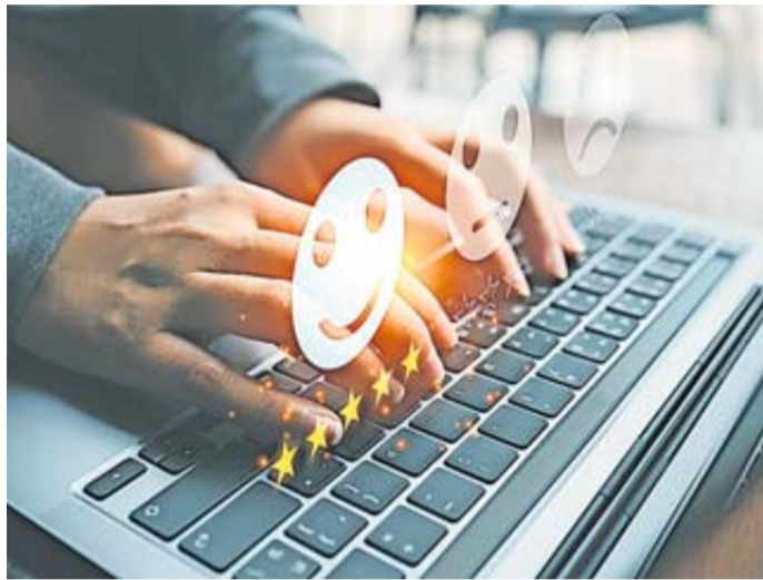
Rosbach startet Bürgerbeteiligung zur Zukunftsgestaltung.

Bereits 2018 wurde in Rosbach v. d. Höhe das Stadtentwicklungskonzept als fachlich inhaltliche Grundlage für die kommunalpolitische Diskussion und Entscheidungsfindung zur nachhaltigen Entwicklung der Stadt von der Stadtverordnetenversammlung beschlossen. Im vergangenen Jahr wurde ein Zwischenbericht zum Stadtentwicklungskonzept erarbeitet. Dieser gibt Aufschluss über den aktuellen Stand der im Konzept verankerten Maßnahmen sowie über die Fortschritte der Stadtentwicklung in den vergangenen Jahren. Der Bericht sowie unser Stadtentwicklungskonzept stehen