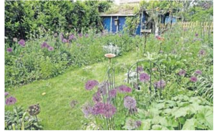
Ein klimafreundlicher Garten.

Auch das Wassermanagement spielt eine wichtige Rolle. Statt Regenwasser einfach abfließen zu lassen, kann es geschickt gespeichert und genutzt werden. Höher gelegte Beete und strukturierte Rasenflächen helfen, Wasser ge-