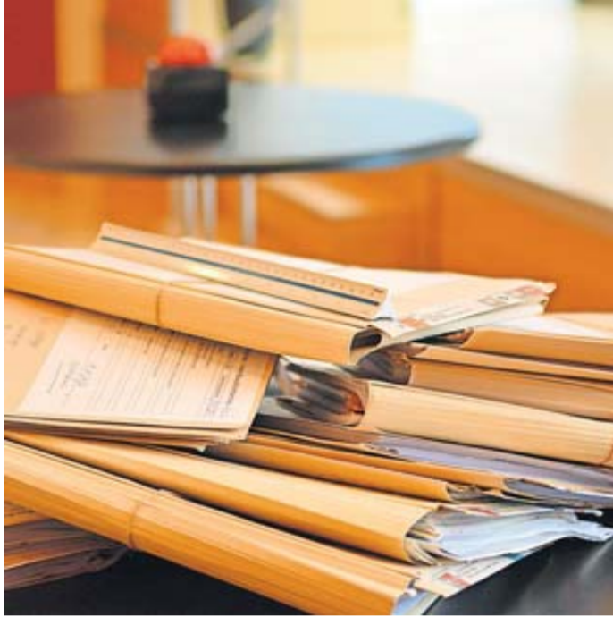
Ab sofort können Bauherren Anträge vollständig digital stellen.