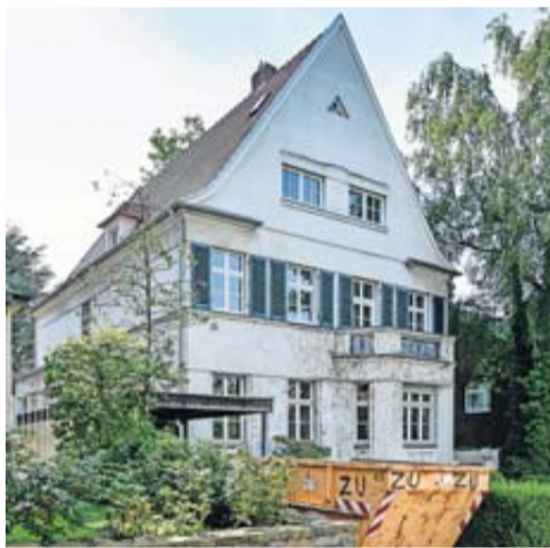
Es muss nicht immer die allumfassende Sanierung sein. Auch kleine Maßnahmen können die Attraktivität einer Immobilie steigern.

tovoltaik retten eine ohnehin schlechte Energiebilanz der Immobilie nicht. Da muss schon deutlich mehr gemacht werden. „Solche hohen Investi-