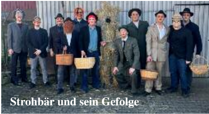
Strohär und sein Gefolge