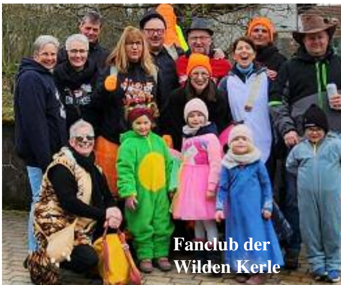
Fanclub der Wilden Kerle