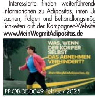
PP-OB-DE-0049 Februar 2025

ratungsangebot in vielen Apotheken deutschlandweit. Neben Informationsmaterialien bieten ausgewählte Apothekenpartner auch Patientenvorträge vor Ort an. Menschen mit Adipositas sollen ermutigt werden, gemeinsam mit medizinischen Fachkräften gegen die Krankheit vorzugehen. Dafür stehen auch Ärztinnen und Ärzten umfangreiche Aufklärungsmaterialien und Informationen für das Wartezimmer zur Verfügung. Interessierte finden weiterführende Informationen zu Adipositas, ihren Ursachen, Folgen und Behandlungsmöglichkeiten auf der Kampagnen-Website: www.MeinWegmitAdipositas.de