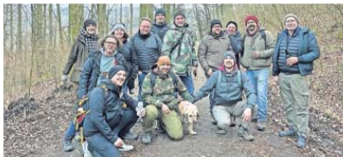
Gemeinsam mit Freunden des Vereins unterwegs auf dem Fußweg nach Sarrod.