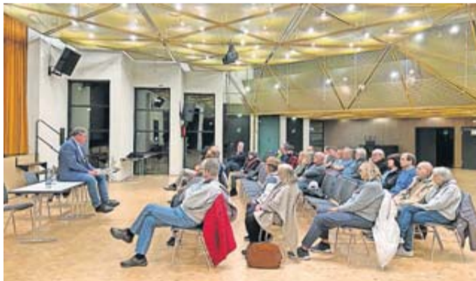
Viele Interessierte kamen zur offenen Bürgerinformationsveranstaltung.