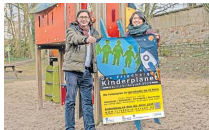
Spannendes Ferienprogramm für Schulkinder auf der Seewiese.

Friedberg. Die Rakete zum beliebten Kinderplaneten steht an der Startrampe bereit. Seit dem 3. März können Friedberger Eltern ihre Schulkinder bis einschließlich zwölf Jahren (die erste Klasse muss bereits absolviert sein) für die zweiwöchigen Ferienspiele anmelden. Sie finden vom 4. bis 15. August von 9 bis 17 Uhr auf der Seewiese statt. Eine eingeschränkte Frühbetreuung ist ab 8 Uhr möglich. In diesen zwei Wochen können sich die Kinder auf ein abwechslungsreiches und spannendes Programm freuen: verschiedene Tagesprogramme wie Ausflug ins Ockstädter Schwimmbad, Sporttag oder einen Ausflug mit dem Bus. Und bei dem vielfältigen AG-Angebot ist für jedes Kind etwas Interessantes dabei. Ansonsten bietet der Kinderplaneten mit seinen breitaufgestellten Materialien und Spielgeräten auf dem Gelände eine Vielzahl an Möglichkeiten für das freie Spielen. Abgerundet werden die Ferienspiele mit dem Abschlussabend am 14. August mit Bühnen-Auftritten der Kinder und einer Kinder-Disco. Bei der Anmeldung für