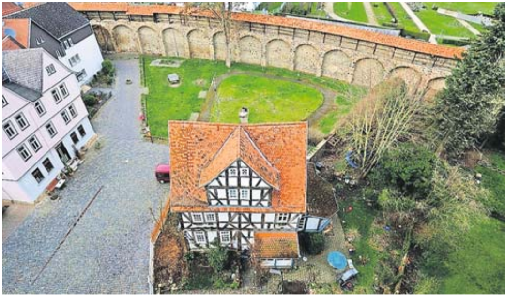
Die Stadtmauer, die die Butzbacher zu ihrem Schutz mit der Erlangung der Stadtrechte errichtet konnten, das sogenannte Weidighaus im Vordergrund und links das ehemalige Haus Bang.

Morgen: Entdecken Sie die Highlights der Stadt Butzbach