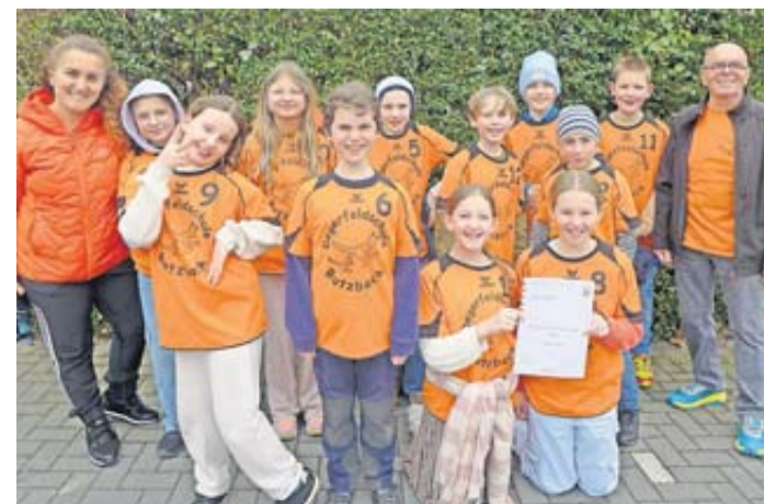
Überglücklich und stolz sind die Schüler der Degerfeldschule, die beim Schwimmwettbewerb der Grundschulen im Wetteraukreis in der Kategorie „Schulen über 150 Schüler“ den Kreis-Vizemeister-Titel erschwimmen konnten.