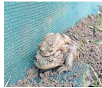
Zwei Erdkröten, unten das Weibchen, oben das Männchen.

Platz gebracht. Dieses ist die höchste Zahl seit Beginn der ehrenamtlichen Betreuung an dieser Stelle. Bald wird der Zaun wieder abgebaut und eingemottet, um im nächsten Frühjahr wieder gesetzt zu werden. Leider kann der sichere Rückweg der Kröten nicht so gut begleitet werden, da sich der Zeitraum der Wanderung über mehrere Monate verteilt. Dies ehrenamtlich zu begleiten ist leider nicht möglich. Einen sichereren Rückweg haben Amphibien nur an den wenigen Stellen, die mit aufwändig gebauten Kröten-tunneln versehen sind. Einen