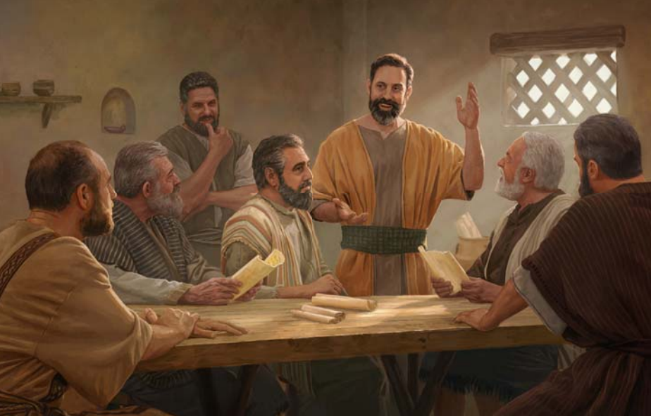
Eine Sitzung der leitenden Körperschaft im 1. Jahrhundert. Diese treuen Männer erkannten, dass wahre Christen ein Volk für Gottes Namen sind (Siehe Absatz 5)

werden wir darüber sprechen, was dieser Name uns ganz persönlich bedeutet.