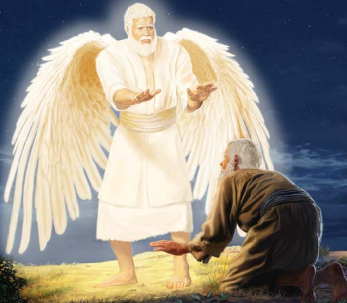
Der Engel bewies im Umgang mit Johannes Demut (Siehe Absatz 5)

6. Wie können wir uns an der Demut der Engel ein Beispiel nehmen?