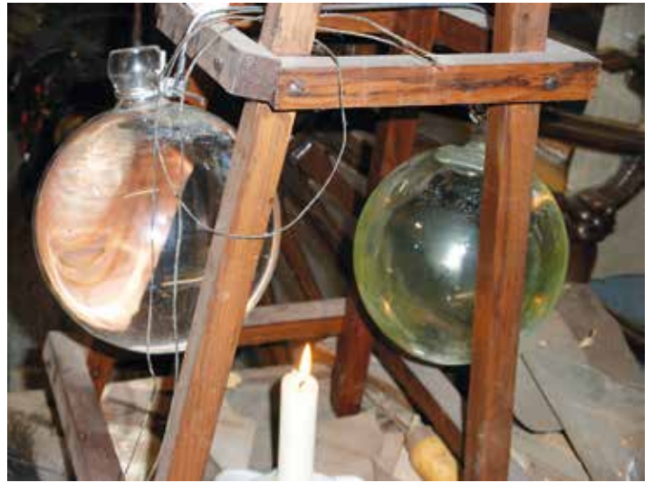
„Schusterkugel“, einst die Beleuchtung der Schuhmacher.

Im Auftrag der teilnehmenden Vereine, Förderkreis Dorferhaltung