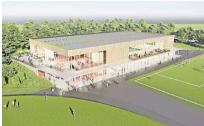
Eine Visualisierung der neuen Sporthalle.

Die nun vorliegende Raumvariante schafft nicht nur optimale Bedingungen für den Hallensport – sie ist auch erforderlich, um die Außen-Sportfelder mit eigenen Umkleidemöglichkeiten zu erschließen. Eine moderne, dreiteilbare Sporthalle, ein