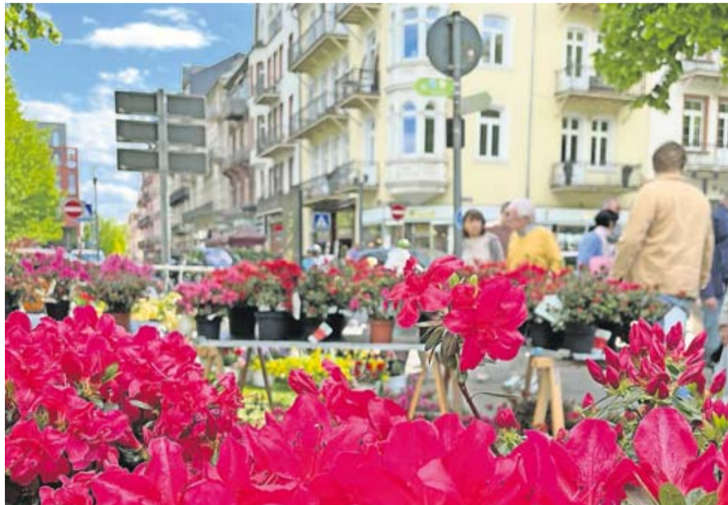
Freuen Sie sich auf ein Wochenende voller Gartenlust und Einkaufsspaß.

Kunsthandwerk und Blumenpracht bei freiem Eintritt in Bad Nauheim