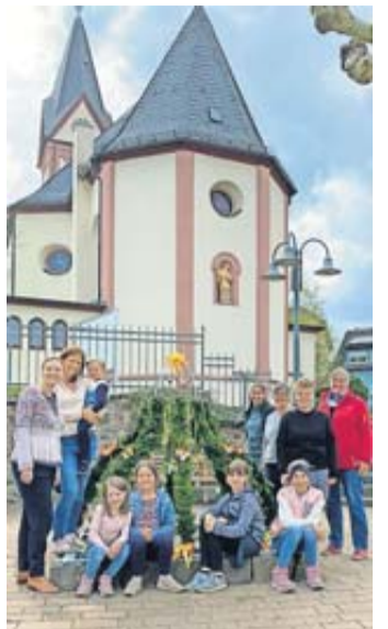
Farbenfrohe Osterkrone erleuchtet das Dorfzentrum in Ober-Wöllstadt.