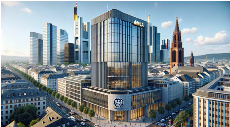
KI-Bild mit DallE generiert

Die neue Geldwäschebekämpfungsbehörde der Europäischen Union, kurz AMLA (Anti-Money Laundering Authority), wird ihren Sitz in Frankfurt am Main haben. Neben Brüssel, Rom und Madrid bewarben sich mit Paris und Dublin zwei weitere Top-Finanzplätze in Europa.