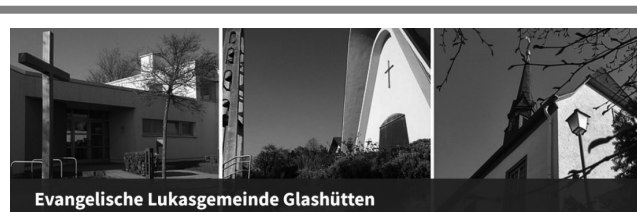
Evangelische Lukasgemeinde Glashütten