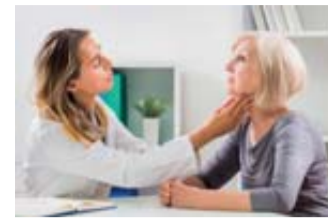
Augen auf beim Schilddrüsencheck.

Eine Besonderheit: Viele Patient:innen mit Morbus Basedow entwickeln zusätzlich eine sogenannte endokrine Orbitopathie (EO). 4 Bei Morbus Base-