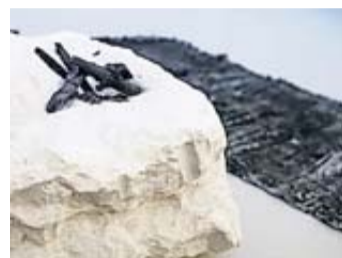
„living room“ – von Aron Herdrich.

dabei mit einem autonomen Bildraum arbeitet, bei dem dieser durch Konstruktion und Dekonstruktion der gegebenen Elemente der Malerei wie Linie, Fläche und Farbe entsteht, geht Herdrich bei seinen Arbeiten von Gegebenem aus und transformiert dieses durch Übersetzen der Elemente in ein anderes Material und in neue Zusammenhänge.