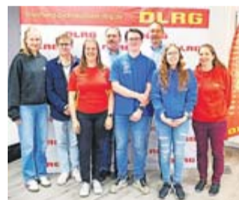
Der neue Vorstand.

Telefon: 0176-11 833 355 E-Mail: key-account@gnz.de