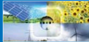
SPAREN UND SCHÖNEN