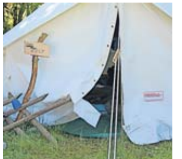
Ein buntes Programm wartet auf die Teilnehmer.

Niddatal. Auch in diesem Jahr veranstaltet die Pfarrei Wickstadt ihr Zeltlager auf dem Jugendzeltplatz Klause im Spessart. Eingeladen sind alle Kinder und Jugendlichen ab zehn Jahren. Es sind noch Plätze frei. Schon seit vielen Jahren organisiert die Pfarrei Wickstadt ein Zeltlager in der ersten Woche der hessischen Schulferien. Kinder und Jugendliche können eine Woche lang auf einem Zeltplatz Zeit in der Natur verbringen.