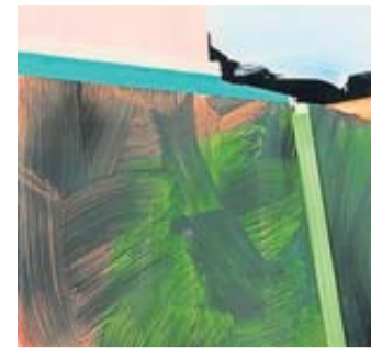
„raum schichten“ – von Ulrike von der Osten.

„Yes, we can!“ Englisch für „Senioren“; 50+ Neue Kurse – vor Ort und online ☎ 060 31 – 685 38 67 ELKA: www.friesl.eu