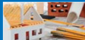
DAS EIGENE HEIM