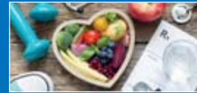
GESUND UND AKTIV