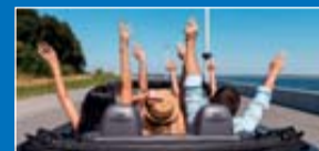
FREIZEIT, HOBBY, SPORT, OUTDOORAKTIVITÄTEN