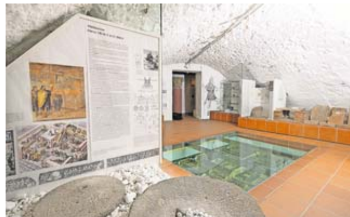
Das Museumsteam freut sich auf Ihren Besuch.

zählt vom Alltagsleben der Menschen in allen Epochen. Die Toilettenbräuche der Römer, Grausamkeiten des Mittelalters, Landgraf Philipp und die Bedeutung der Trachten im Umland sowie Butzbach als Handwerkerstadt auf dem Weg zum Industrieschwerpunkt sind Themen bei diesem Museumsrundgang. Das Museum ist am morgigen Sonntag, den 18. Mai, von 10 bis 12 Uhr und 14 bis 17 Uhr geöffnet.