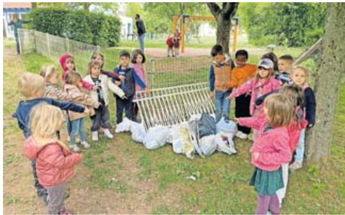
Die fleißigen Müllsammler.

Mülltonne?“ Diese Frage blieb unbeantwortet. Die Aktion beim „Sauberhaften Kindertag“ war für das Team Kinderbrücke erfolgreicher als erhofft. Alle waren sich einig: „Müll darf man nicht einfach in die Natur werfen. Dafür gibt es Mülltonnen.“ Bleibt zu hoffen, dass der Hochzeitswald jetzt sauber bleibt.