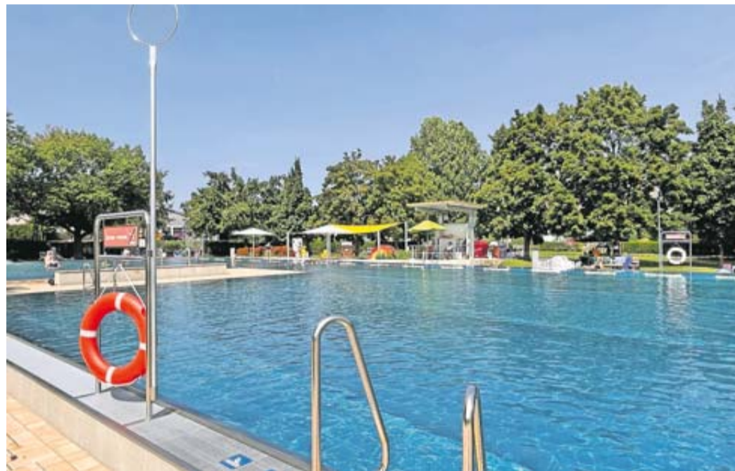
Das Rodheimer Freibad lädt ab sofort wieder zum Baden ein.

moderat: Erwachsene zahlen 5 Euro, Kinder und Jugendliche ab elf Jahren 2,50 Euro. Dutzend- und Dauerkarten sind ebenfalls erhältlich. Dutzendkarten für Erwachsene kosten 50 Euro und Dauerkarten 90 Euro. Kinder und Jugendliche erhalten diese Tickets zum halben Preis. Details zu Ermäßigungen sind in der Gebührenordnung der Stadt zu entnehmen. Ab Juni starten die Schwimmkurse der Schwimmschule Fisch. Außerdem finden dienstags und freitags Wassergymnastikkurse der Reha-Sportabteilung der SG Rodheim statt. Anmeldungen hierfür nimmt Nagel unter der Telefonnummer 0160/5766675 entgegen. Neu in dieser Saison sind Tischtennisplatten und ein neuer Kioskpächter.