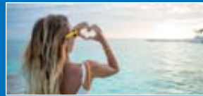
URLAUB UND ERHOLUNG