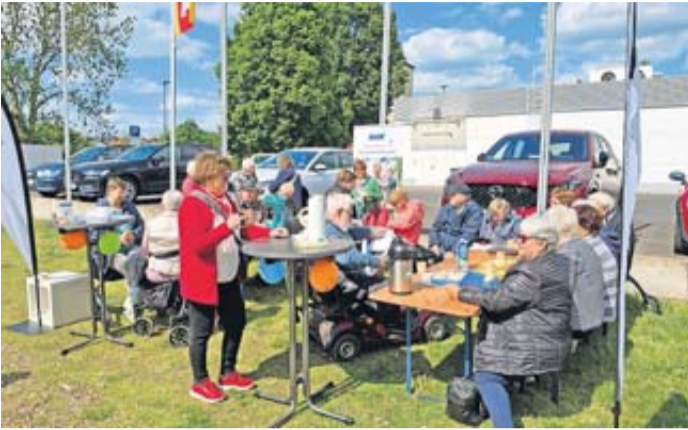
Tolles Wetter und ein gut besuchter Stand.

Florstadt. Das kürzliche Mai-Treffen des VdK-Ortsverbandes Nieder-Florstadt stand unter einem guten Stern: Bei sonnigem Wetter präsentierte sich die Ortsgruppe auf dem Florstädter Wochenmarkt mit einem Infostand und steht Neugierigen und Mitgliedern Rede und Antwort. Der gut besuchte Infostand zeigte, dass Menschen Interesse am VdK haben und soziale Themen wie Gesundheit, digitale Patientenak-