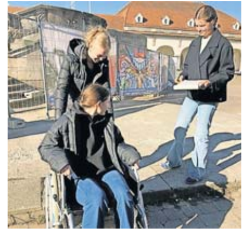
Entdecke dein Bad Nauheim im Rollstuhl – Konfirmandinnen der ev. Kirche unterwegs.

Ihre Ergebnisse halten die Jugendlichen in einer Liste fest, so zum Beispiel Abschnitte, die nicht barrierefrei sind oder wo sie andere hilfreiche Hinweise oder Kritik haben. Die schwierigsten Passagen? Als einer der jungen Leute im Rollstuhl sitzt und versucht den Weg zum Kurhaus aus eigener Kraft zu bewältigen. Die Gruppe ist sich einig, dass ein Gast im Rollstuhl diesen Weg bes-