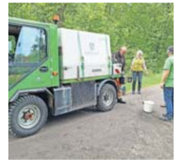
Der Kur- und Servicebetrieb der Stadt unterstützt die Helfer.

Teilnehmern mitzubringen sind lediglich ein kleiner Eimer, ein Putzschwamm und milde Reinigungsmittel. Voraussichtliches Ende ist gegen 14 Uhr. Im Anschluss lädt die BI alle Helfer zu einem kleinen Imbiss und erfrischenden Getränken an der Wilbrandthütte ein.