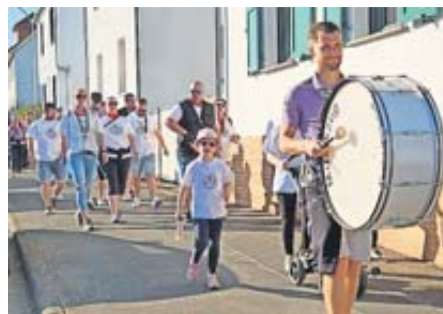
Impressionen der diesjährigen Brennnesselkerb in Nieder-Wöllstadt – schon jetzt wird sich auf nächstes Jahr gefreut.