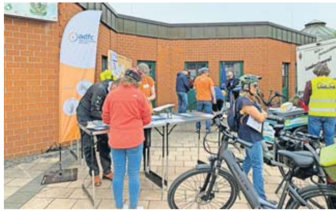
Die Rosbacher Fahrradmesse – für Groß und Klein.

Zur Einstimmung auf den Aktionszeitraum findet am Freitag, den 6. Juni, von 15 bis 19 Uhr erstmals eine Fahrradmesse auf dem Schulhof der Kapersburgschule in Rosbach