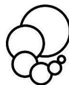
Kulturkreis Glashütten e. V.