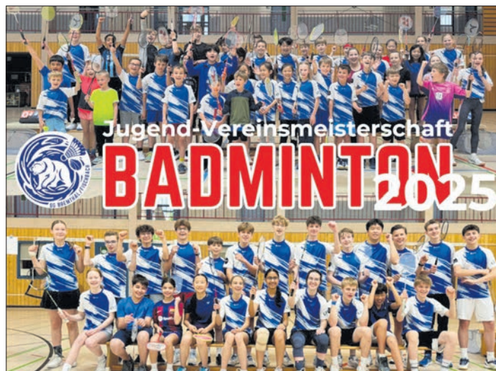
Mehr als 70 Kinder und Jugendliche tummelten sich bei den Badminton-Vereinsmeisterschaften der SG Bremthal/Fischbach.