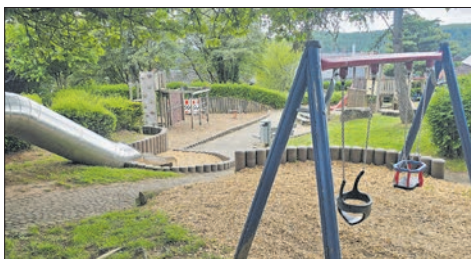
Spielplatz Holderbusch nach Reparaturen wieder freigegeben.