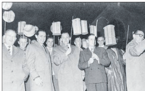
Ein Ständchen der Sänger mit Laternen.

Ein Blick über Bremthals Grenzen hinaus zeigt, dass die Zeiten im noch jungen deutschen Kaiserreich unruhig waren: Deutschland war erst seit 1871 geeint. 1875 provozierte Reichskanzler Otto von Bismarck eine außen-