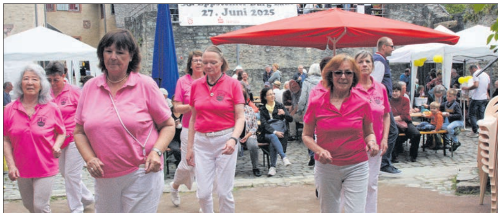
Die Gruppe „Tanzfreu(n)de“ der TSG Ehlhalten zeigt ihr Können auf dem Burghof.