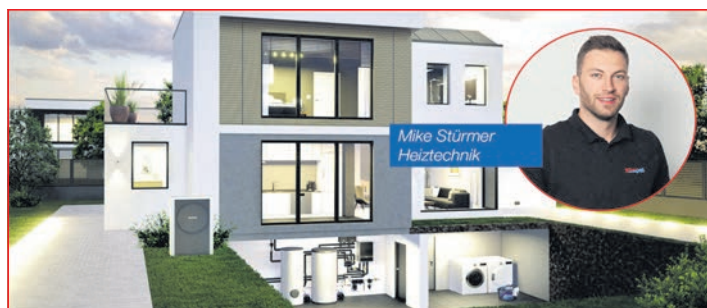
Mike Stürmer Heiztechnik

Hofgut Hof Häusel • 65817 Eppstein/Taunus service@mb-baumdienste.de • www.mb-baumdienste.de