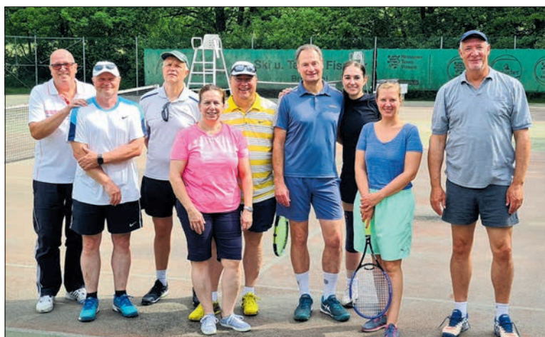
Tennis verbindet – beim Ehlhaltener TC würde mit viel Spaß um Schleifchen gespielt.

Am vergangenen Sonntag trafen sich Tennisbegeisterte zum zwischenzeitlich liebgewonnenen, sportlichen Highlight des Ehlhaltener TC, dem Schleifchenturnier. Der ergiebige Regen bis in die frühen Morgenstunden hielt die Teilnehmer nicht davon ab, auf die schöne Tennisanlage am Dattenbach in Ehlhalten zu kommen. Bei Sonnenschein