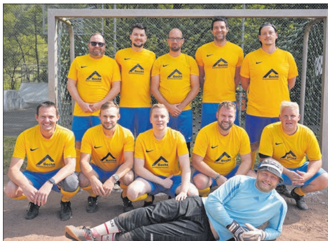
Die Ehlhaltener Freizeitkicker „Silberbachrecken“ siegen im eigenen Turnier in der Arena am Dattenbach.

Egal wen man fragte, es war ein rundum gelungener Tag auf dem beliebten Bolzplatz.