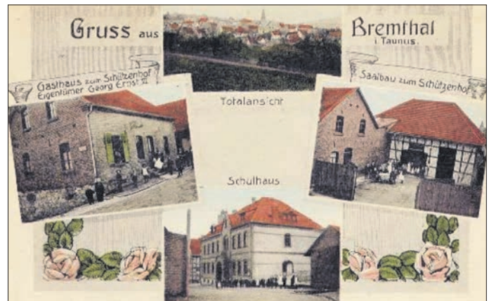
Eine Ansichtskarte von Bremthal um 1911 zeigt das Gasthaus zum Schützenhof, das damals Vereinslokal wurde.

Mit dem Bau der Comenius-Turnhalle eröffneten sich dem Chor und allen anderen Vereinen ganz neue Möglichkeiten, Feste und