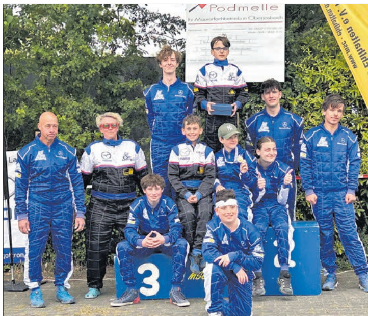
Die Kartfahrer des MSC Ehlhalten mit ihren Trainern und Betreuern.

Neben dem sportlichen Teil kam auch das leibliche Wohl nicht zu kurz. Das engagierte