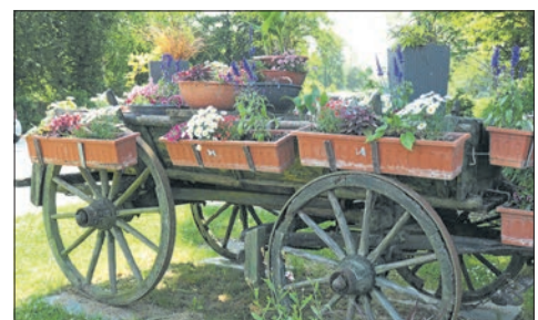
Der alte Leiterwagen in Niederjosbach ist schon ziemlich morsch. Dieses Jahr blüht er jedoch noch einmal auf.

Alle zwei Wochen sind Pflege-Arbeiten auf den fünf Friedhöfen angesagt. Die Spielplätze müssen turnusmäßig instandgesetzt werden. „Den Spielsand haben wir bereits ausgetauscht“, sagt Luther. Im Juli und im August stehen Auf- und Abbau sowie Versorgungsfahrten für die Burgfestspiele an, im Winter die Bereitschaft für den Winterdienst. Dann herrscht Urlaubssperre. „Deshalb müssen alle Kollegen in den restlichen sieben Monaten des Jahres ihren Urlaub nehmen.“ Dann fehlen immer einige bei den Außenarbeiten. bpa