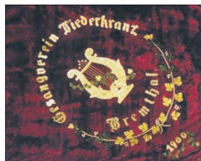
Das Sängersymbol, die Lyra, auf der Vereinsfahne von 1900.

Jetzt bereiten sich Sängerinnen und Sänger auf das nächste große Fest vor: 150 Jahre Liederkranz im Festzelt auf dem Festplatz an der Wildsächser Straße. bpa