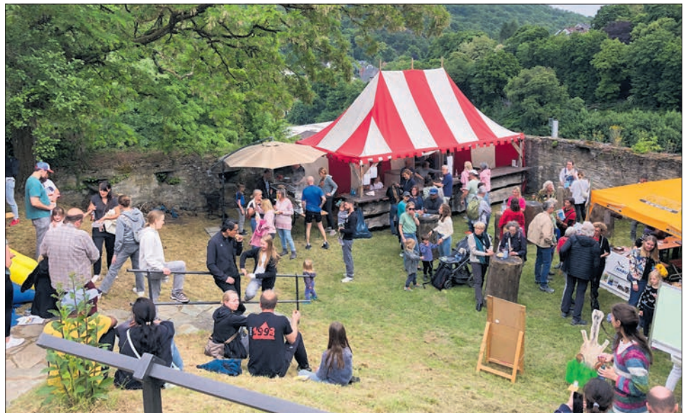
Im Ostzwinger gab es Verpflegung, Informationen und Spiele.

Montag: Der BUND lädt zur Naturwanderung nach Eppenhain ein. Treffpunkt ist um 10 Uhr am Ende der Freiherr-von-Ickstatt-Straße. Um 11 Uhr beginnt das Fels'chen-Fest der Handballer auf dem Sportplatz Bienroth.