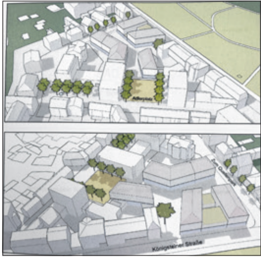
Blick auf das städtebauliche Konzept für die Neuordnung des Adlerkarrees