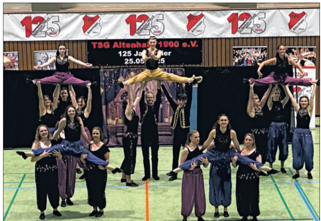
Die Interpretation von „Aladins Wunderwelt“ begeisterte die Zuschauerinnen und Zuschauer