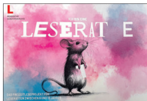
Ab sofort können sich Leseratten-Schülerinnen und -Schüler anmelden.

Die Aktion startet am Montag, 23. Juni; die ausgeliehenen Bücher müssen dann spätestens am 4. Oktober im 14-Tage-Ausleihturnus zurückgegeben werden. In dieser Zeit sollen die Kinder so viele Titel wie