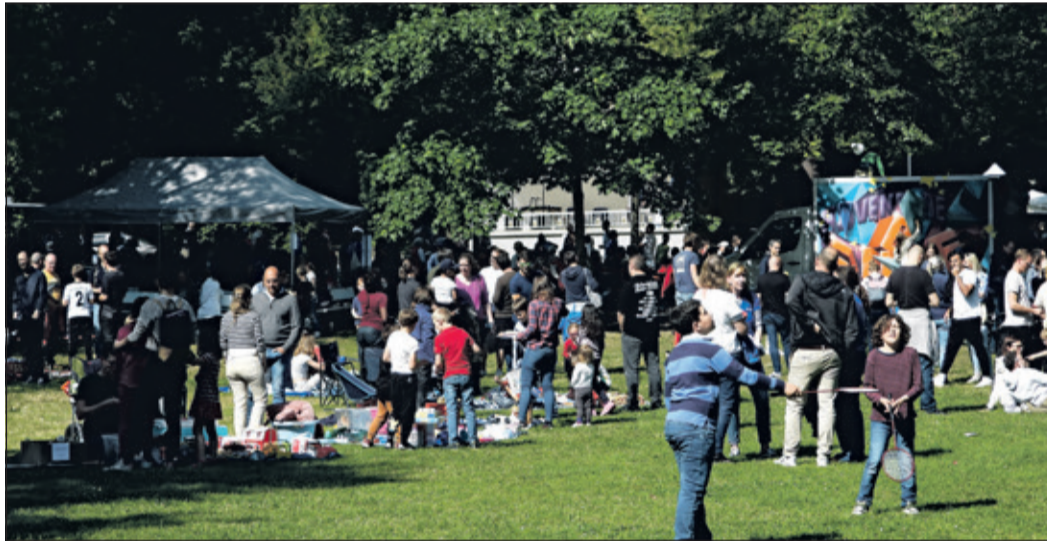
Das Familienfest der TG Bad Soden war überaus gut besucht – sowohl die Gäste als auch die Vereinsmitglieder waren begeistert.

Die Angebote des Sportvereins spiegeln sich in den Spielen auf dem Familienfest wider. Allgemein bekannt fehlt es vielen Kindern heute an Bewegung – die große Auswahl an sportlichen Aktivitäten war die richtige Gelegenheit mal auszuprobieren, welche Sportart man gerne ausübt. Mit Begeisterung stürzte sich der Nachwuchs auf das Kletterauto „Adventure Cube“ und auf die Slackline, die im Park aufgespannt war. Mit einer Stempelkarte konnten die einzelnen Stationen abgehakt werden – für die volle Karte gab es natürlich auch eine Belohnung. Konzentrationsübungen wie Eierlaufen, Austoben beim Sackhüpfen oder einen Hockeyball ins Tor lupfen weckten die Leidenschaft für den Sport. Zwischendurch bummelte man über den kleinen Deckenflohmarkt, der auf der Wiese aufgebaut war. Vor allem Spielzeuge ließen hier die Herzen höher schlagen. Das aufblasbare Volleyballnetz und das Kinderschminken fanden ebenfalls großen Anklang. „Es macht mir viel Spaß“, erzählte die 6-jährige Katharina-Elisabetha, die mit ihren Großeltern gekommen war. Noch einmal das