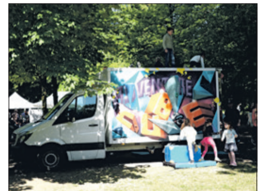
Das Klettermobil „Adventure Cube“ war bei den Kindern sehr beliebt.