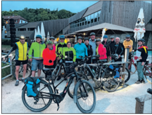
Die Teilnehmer der ADFC Feierabendtour hatten sichtlich Spaß – und gutes Wetter.

Bad Soden (bs) – So schnell vergehen drei Wochen! Die diesjährige STADTRADELN-Aktion ist zu Ende – und es gibt Grund zur Freude: 2025 haben sich mehr Radelnde aus Bad Soden am Taunus registriert als je zuvor! Zum ersten Mal haben über 200 Radelnde teilgenommen und sich dafür in 20 Teams organisiert. Die Teilnehmer haben nun noch sieben Tage Zeit, um ihre erradelten Kilometer hochzuladen, bevor die endgültigen Ergebnisse feststehen.