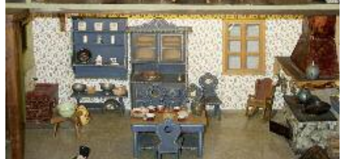
Bild: Blick in eine der historischen Puppenstuben im Brachtal Museum

Anmeldungen sind auch möglich unter www.brachtal-museum.de , auf facebook unter Museumsverein Brachtal oder bei Ulrich Berting (Tel 0178-8281945) oder Erich Neidhardt (Tel 06053-600067).