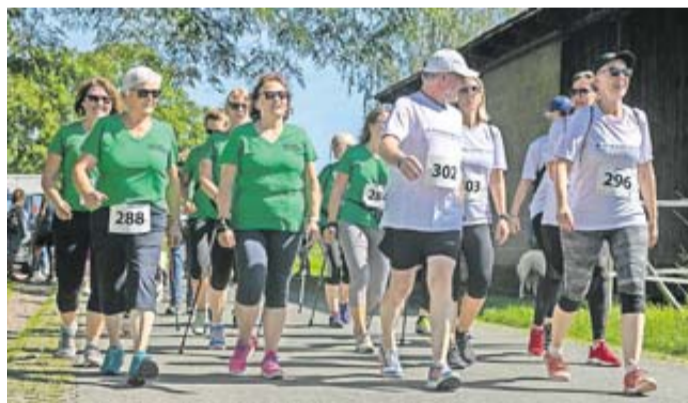
Jetzt anmelden und mitlaufen!

Wetteraukreis. „Wir machen Meter für Toleranz & Teilhabe“ lautet das Motto des 5. Wetterauer Tintenfasslaufs. In diesem Jahr ist der Benefizlauf am Samstag, dem 21. Juni zu Gast beim Traiser FC – Sportplatz am Wäldchen. Der Erlös der Veranstaltung wird zu hundert Prozent für Kinderhilfsprojekte in der Region verwendet. Ab 13 Uhr geht es los. Von der Bambini- und Rolli-Strecke mit 400 Metern über den Schülerwettbewerb mit 1.000 Metern und den Run & Walk-Strecken von fünf und zehn Kilometern ist für jeden Aktiven das Passende dabei: