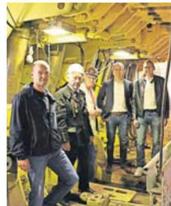
Ein informativer und erfolgreicher Besuch in Borken.

die früher im Wetterauer Revier im Einsatz war. Zum Abschluss wurde noch kurz die Borkener Seenlandschaft besucht, die wie in Wölfersheim durch den Braunkohlebergbau entstanden ist. Wirklich besonders wurde die Führung durch die Berichte und Eindrücke der Zeitzeugen. „Zahlreiche Details aus der Geschichte der PreussenElektra sowie persönliche Anekdoten der ehemaligen Mitarbeiter verdeutlichten, wie sehr diese Zeit die Region und ihre Menschen geprägt hat. Das hat einmal mehr gezeigt, wie wichtig es ist, diese Eindrücke zu bewahren.“ unterstreicht Bürgermeister Eike See. Dies möchte man in Wölfersheim durch die Einbindung eines Fachbüros erreichen. „Auch in Wölfersheim möchten wir, dass die Leistungen und die Lebensrealität der Menschen aus der Zeit des Bergbaus sichtbar bleiben.“ Besonders