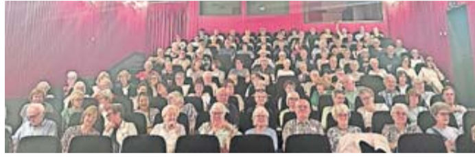
Das nächste Seniorenkino kommt bestimmt.

Karben. Bereits zum wiederholten Mal lädt die Stadt Karben zu einem besonderen Kinoerlebnis für Senioren ein – und das mit großem Erfolg. Fast 200 Gäste finden sich im Karbener Kino ein, um gemeinsam einen heiteren Nachmittag zu verbringen. Bei einem Glas Sekt, Wasser oder Orangensaft wird im Foyer angestoßen, gelacht und lebhaft geplaudert. Viele nutzen die Gelegenheit, um alte Bekannte zu treffen oder neue Kontakte zu knüpfen. Anschließend öffnet sich der Vorhang für die französische Komödie „Voilà Papa!“, die das Publikum mit viel Witz, Charme und Leichtigkeit begeistert. Der warmherzige