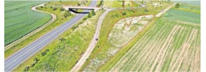
Lage der Blumenwiese in der Diebsschleich.

kann“. Unmittelbar angrenzend konnten mehrere im Zuge des Baus der Ortsumfahrung falsch angelegte und für die Natur nachteilig gepflegte Flächen besichtigt werden. Alle Teilnehmer waren sich in dem Wunsch einig, dass auch von den Behörden auf Flächen im öffentlichen Eigentum mehr echte Blumenwiesen angelegt werden und eine naturförderliche Pflege erfolgt.