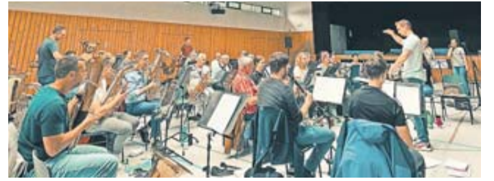
Die Wettertaler Blasmusik nach Probewochenende bereit.

Wettertaler Blasmusik lädt zum Konzert ein