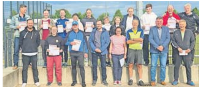
Die Sportler mit ihren Auszeichnungen.

schon Sportabzeichen“ an die Aktiven. In vier Kategorien hatten im Vorjahr 2024 insgesamt 26 Sportler der SG Rodheim - 2023 waren es 40 - die geforderten Leistungen erfüllt, so dass ihnen eine Auszeichnung in Bronze, Silber und Gold überreicht werden konnte. Auch diesmal waren wieder einige Wiederholer darunter. Manche sind von Anfang an dabei. Viele Krankenkassen unterstützen den erfolgreichen Erwerb des Sportabzeichens.