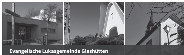
Evangelische Lukasgemeinde Glashütten