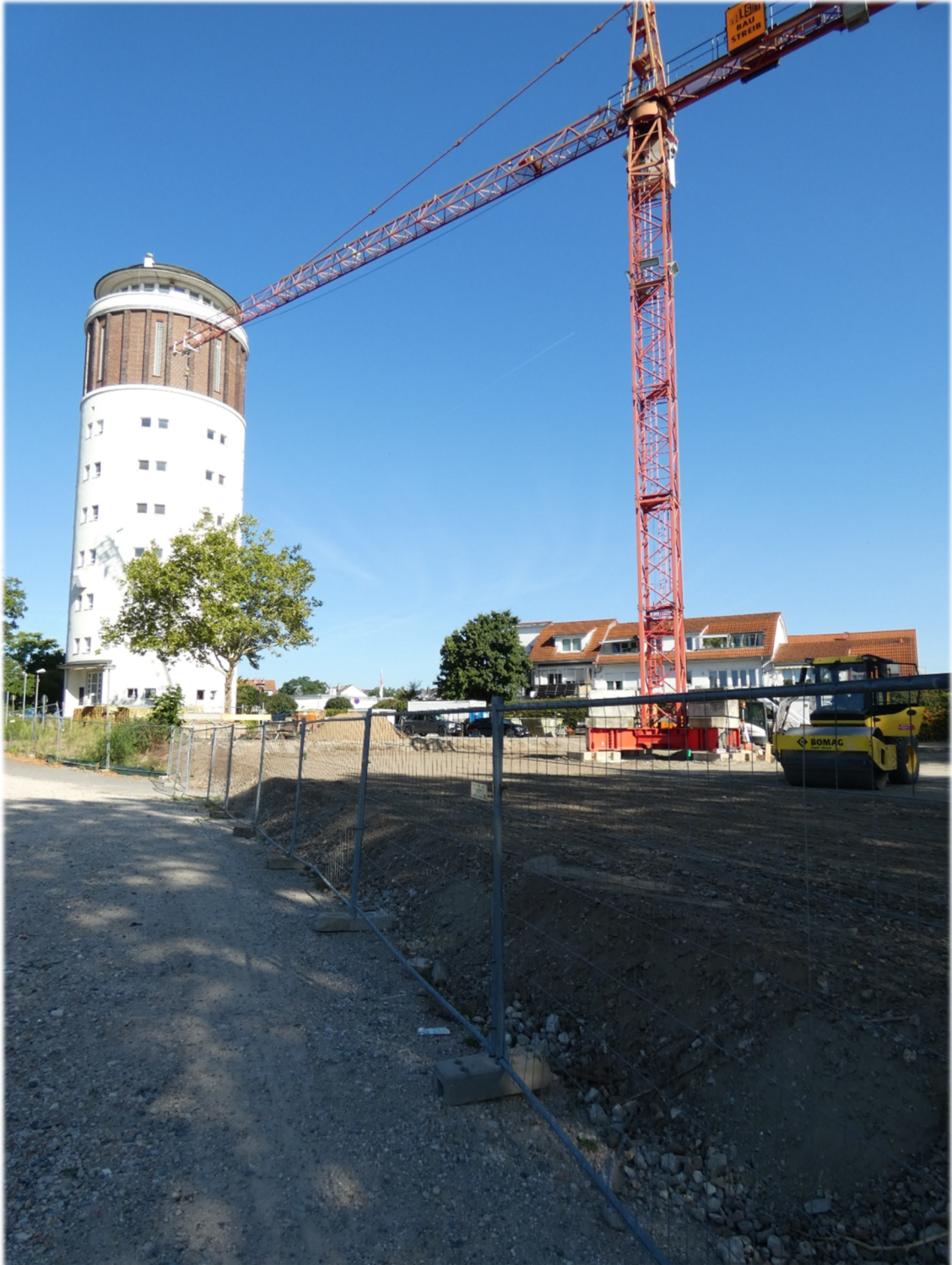
Beginn der Gründungsarbeiten nach Rodung des Grundstücks