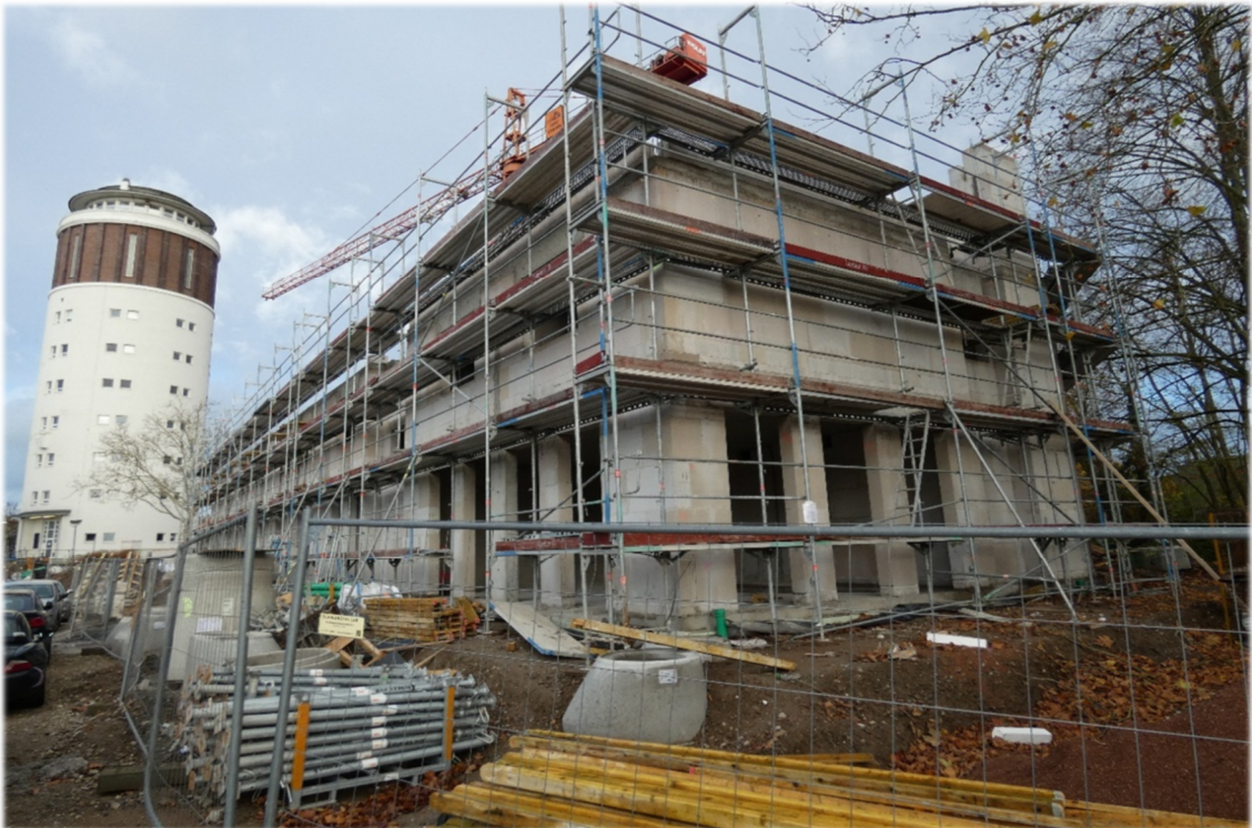
Blick auf die Berufsschule und den Wasserturm