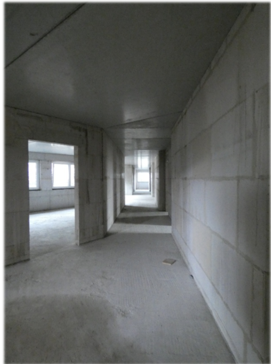
Innenräume mit und ohne Baustützen