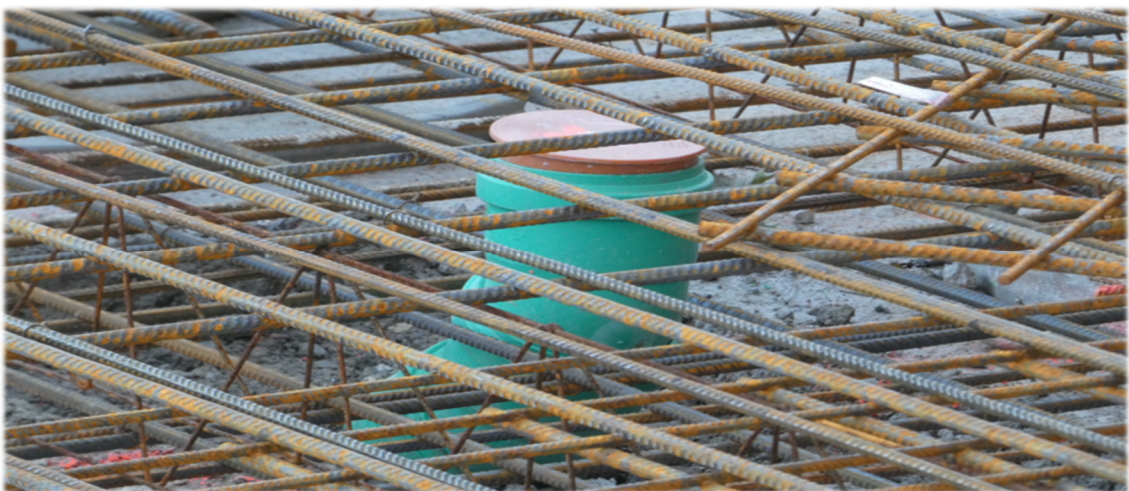
Bewehrung der Bodenplatte