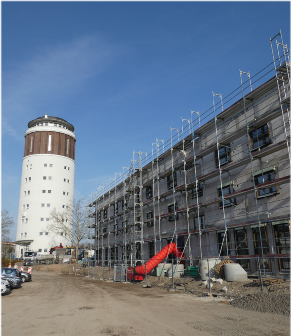
Fertiggestellter Rohbau vor dem Groß-Gerauer Wasserturm

Die Beruflichen Schulen Groß-Gerau sind eine der vier Berufsschulen in Deutschland, in denen Auszubildende zum Gerüstbauer/zur Gerüstbauerin unterrichtet werden. Einzugsbereich dieser Schule sind die südlichen und südwestlichen Bundesländer Deutschlands. Der Kreis Groß-Gerau hat mit der SOKA GERÜSTBAU einen langfristigen Erbpachtvertrag für das Grundstück in der Sudetenstraße 1 in Groß-Gerau abgeschlossen. Dort wird direkt neben den Beruflichen Schulen ein Schüलगästehaus errichtet, in dem die Auszubildenden zukünftig während des Besuchs des Blockunterrichtes übernachten können.