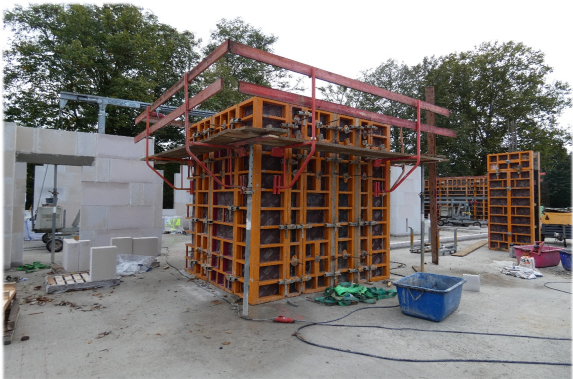
Schalungsarbeiten am Aufzugsschacht im Erdgeschoß

1 Als Abzinsungssatz wurde der von der Deutschen Bundesbank ermittelte durchschnittliche Marktzins der letzten 10 Jahre für eine angenommene Restlaufzeit von 15 Jahren in Höhe von 1,90 % p.a. verwendet. Bei einer Berechnung mit dem durchschnittlichen Marktzins der letzten sieben Jahre in Höhe von 1,96 % würde die Pensionsrückstellung zum 31. Dezember 2024 2.079.701,00 € betragen. Der Unterschiedsbetrag von 18.906,00 € unterliegt einer Ausschüttungssperre.