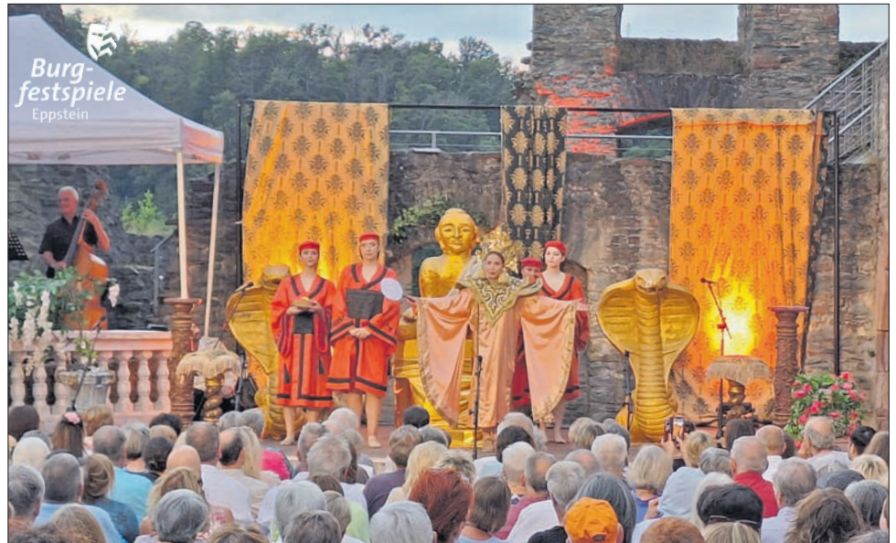
Mit prächtigen Kostümen und Kulissen entführte die Opera Classica Europa die Festspielbesucher ins „Land des Lächelns“.

Samstag, 9. August: Die „Wunderbar“ Am Stadtbahnhof lädt ab 18 Uhr zur spanischen Nacht mit der kubanischen Sängerin Nicky Márquez und Band ein. Auf der Burg beginnt um 19 Uhr das Konzert von Main Accordion Youth . Einlass zu Snacks und einem Quiz ist bereits um 17 Uhr.