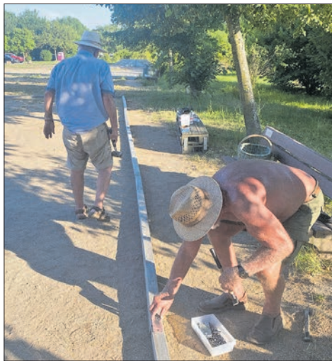
Fast wie in Südfrankreich: Helfer mit Sonnenhut auf dem Kopf befestigen die neue Umrandung am Boule-Platz in Bremthal.

Nicht nur Eppsteiner freuen sich auf das Boulespielen in Bremthal. Auch Nachbarn aus Wiesbaden, Niedernhausen und Idstein kommen regelmäßig und haben das Projekt mitfinanziert. Interessierte können den Platz jeden Tag nutzen, auch parallele Veranstaltungen sind möglich, da genügend Platz vorhanden ist. Selbst Montagnachmittag, wenn die hie-