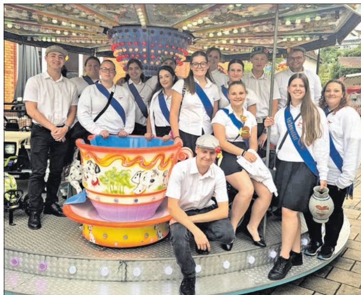
Kerbmädchen und -burschen versammeln sich auf dem Kinderkarussell, das wieder zahllose Runden auf dem Dorfplatz drehte.