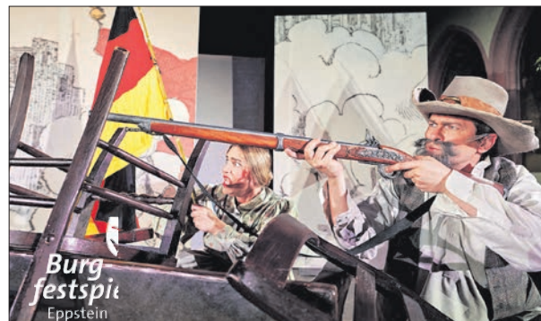
Auf die Barrikaden geht „Die Fliegende Volksbühne“ auf Burg Eppstein.

Es treten auf: Revoluzzer, Reaktionäre, Paulskirchenabgeordnete, engagierte Bürgerinnen, besorgte Schoppepetzer und drei freche Musikanten. Die Zuschauer dürfen auf ein Theaterstück nach historischen Berichten, Biographien und Verhörprotokollen des „Pein-