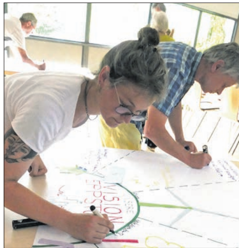
Auf großen Blättern notieren die Teilnehmer Gedanken und Anregungen zum Klimaschutz und kamen miteinander ins Gespräch.

Zu den Aufgaben des Klimaschutzmanagers gehört es, im Verbund mit den Kommunen auf die Ziele aus dem Klimaschutzkonzept des Kreises hinzuwirken. Dazu gehört zum Beispiel die Reduktion des „Treibhausgases“ CO 2 um ehrgeizige 83 Prozent bis 2040 im Vergleich zu 2015. Laut Kreistagsbeschluss soll Krehan die im Klimaschutzkonzept festgeschriebenen Maßnahmen, die allesamt unter Finanzierungsverbehalt stehen, aktualisieren und priorisieren und dem Kreistag jährlich einen Bericht vorlegen. Das Klimaschutzkonzept ist auf der Internetseite des Kreises unter www.mtk.org abrufbar (Suchwort „Klimaschutzkonzept“).