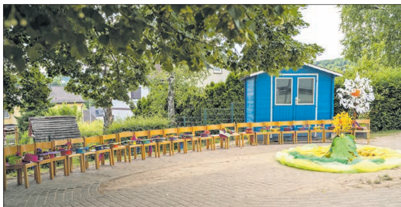
Für jedes Vorschulkind wurde ein individuell gebastelter College-Hut auf sein Stühlchen im Garten gelegt. Zum Abschied flogen die Hüte dann in die Luft.