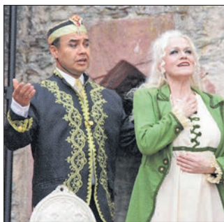
Sou-Chong und Lisa gestehen sich ihre Liebe.