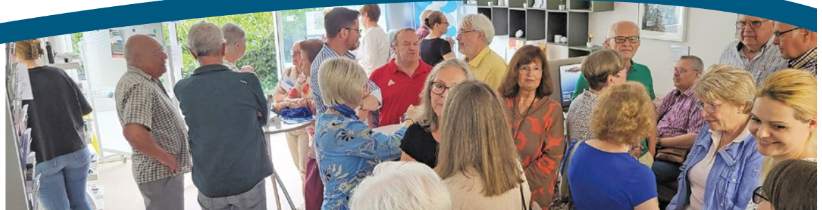
Joachim Reimann Bürgermeister

Ob Versorgung, Infrastruktur oder Digitalisierung – es sind genau die Bereiche, in denen wir kontinuierlich dranbleiben, auch wenn nicht alles sofort umsetzbar ist. Schritt für Schritt arbeiten wir daran, Taunusstein gut für die Zukunft aufzustellen.