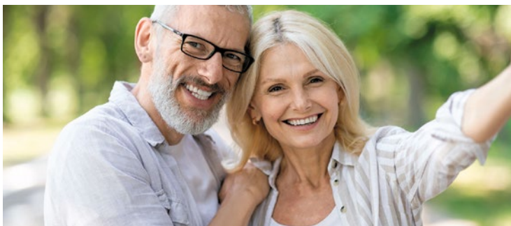
Fitte Gelenke: Wer das Leben aktiv und schmerzfrei genießen möchte, sollte auf die richtige Ernährung und moderate Bewegung achten.

Meldet Euch gern bei Barbara.kahlen@t-online.de .