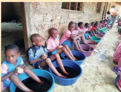
Behandlung an einer der vielen Schulen

Wir haben uns zum Ziel gesetzt, pro Jahr zwischen 15.000 und 20.000 Menschen (überwiegend Kinder) in Kenia von Jiggers zu befreien und ihnen so ein Stück