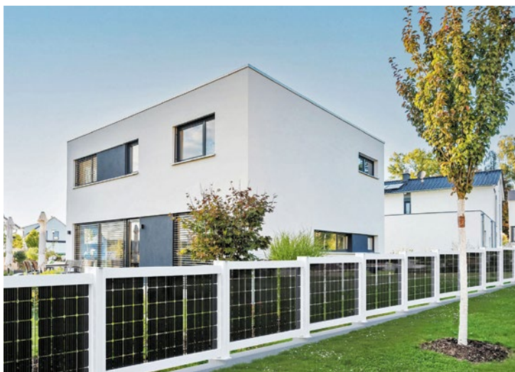
Mit ihrem Design passen Solarzäune sehr gut zu den verschiedensten Architekturstilen.

So lassen sich moderne Zaunsysteme in unterschiedlichsten Farbtönen nach Wunsch gestalten, damit sich der neue Sichtschutz harmonisch ins architektonische Gesamtbild einfügt. Eine Premium-Pulverbeschichtung sorgt zudem für eine langlebige, ansprechende Optik. Auch eine LED-Ambientebeleuchtung lässt sich integrieren. Mit einer robusten Bauweise sind Solarzäune pflegeleicht und widerstandsfähig gegenüber Wettereinflüssen. Die Kabelführung erfolgt verdeckt innerhalb der Pfosten, wodurch das System optisch unaufdringlich bleibt.