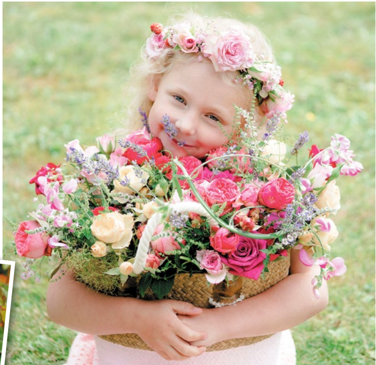
Ein Genuss für alle Sinne: Mit Duftrosen lassen sich Oasen der Entspannung gestalten.