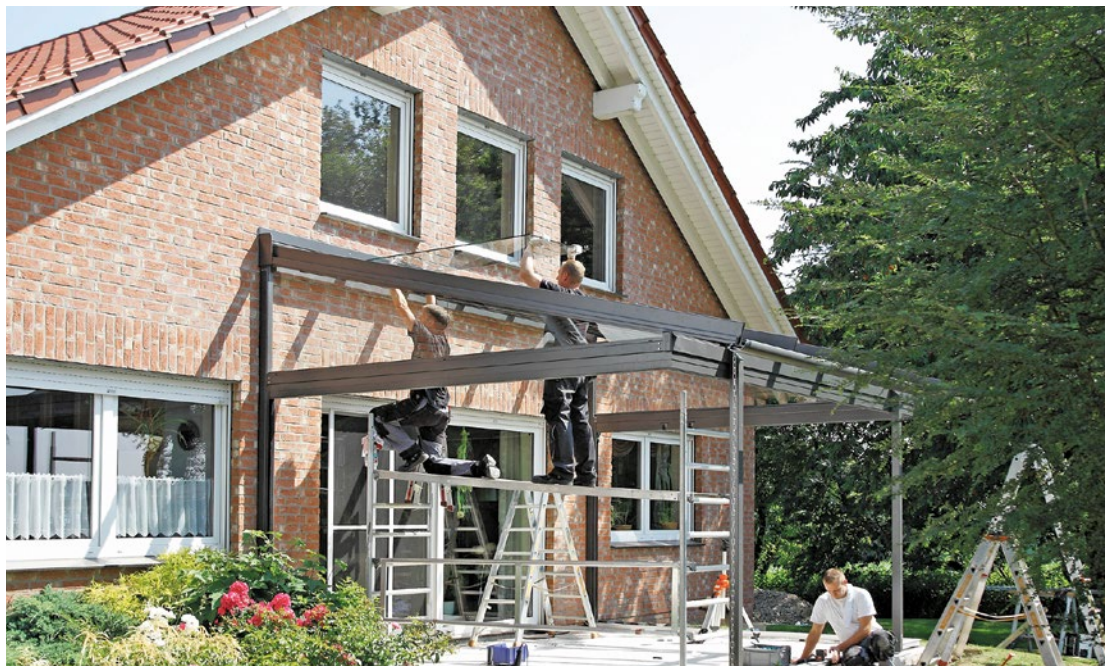
Auf Dauer sicher: Mit zertifizierten Terrassenbedachungen entscheiden sich Hauseigentümer für eine langlebige Lösung.

Normen und Kennzeichnungen sind für alle in der EU vermarkteten Produkte verpflichtend. Allerdings besteht online eine rechtliche Grauzone, weshalb Hauseigentümer nicht jedem Angebot blind vertrauen sollten. Zwei Kennzeichnungen sind besonders wichtig: Das CE-Zeichen bestätigt die Einhaltung europäischer Sicherheitsanforderungen. Die Norm DIN EN 1090 gewährleistet die statische Sicherheit tragender Bauteile und deren Widerstandsfähigkeit gegenüber Wind- und Schneelasten. Viele Billigprodukte erfüllen diese Standards nicht. Unter Regen oder Schneelast können sie plötzlich nachgeben und einstürzen. Die sichere Alternativ zum Onlinekauf ist daher der Weg zum Fachbetrieb: Hier gibt es eine professionelle Beratung, ein detailliertes, kostenloses Angebot sowie transparente Informationen zur Produktqualität. Renommierete Hersteller wie Solarlux bieten zudem die Möglichkeit, Produkte vor Ort zu besichtigen – entweder in der Firmenzentrale oder bei zertifizierten Fachhändlern. Sind alle Qualitätsmerkmale erfüllt und erfolgt die fachgerechte Montage durch geschultes Personal, steht dem Outdoor-Vergnügen nichts mehr im Wege.