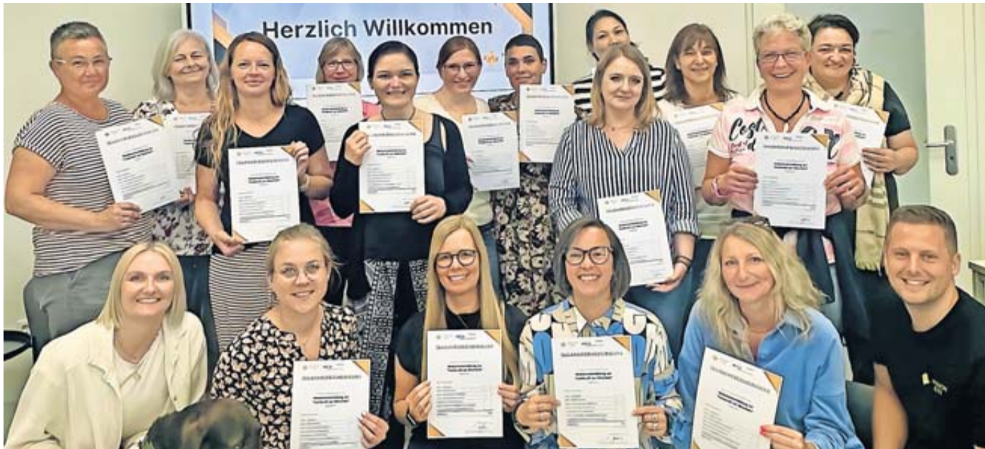
Die ersten „Fachkräfte zur Mitarbeit“, die im Rahmen der Kooperation von Main-Kinzig-Kreis und Mission Kita ausgebildet wurden, haben ihre Zertifikate erhalten.

Erfolgreicher Abschluss der Weiterbildung „Fachkraft zur Mitarbeit“