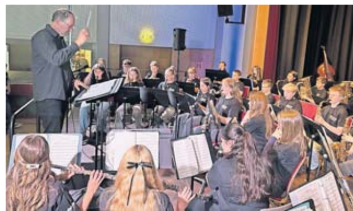
Ein Abend voller Musik.