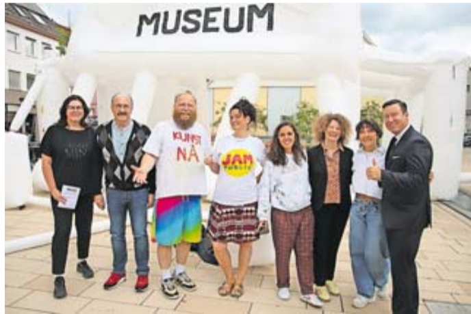
Das Zelt ist auf dem Stadtplatz aufgeblasen. Es freuen sich die Spitzen der Stadt Schlüchtern zusammen mit den Künstlern.

Nun zogen die Künstler auf den zentralen Stadtplatz unter dem Leitgedanken „Die Stadt als Museum“. In Windeseile war das Kunstwerk aus Norwegen aufgeblasen, um Bürgerinnen und Bürgern die Möglichkeit zu geben, sich in Sachen Kunst zu beteiligen. „Zeige etwas, das die Welt sehen muss – vielleicht