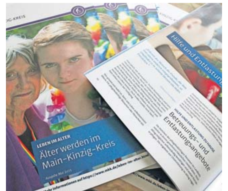
Die Infobroschüre „Älter werden im Main-Kinzig-Kreis“ ist ab sofort erhältlich.

Alle Kommunen des Main-Kinzig-Kreises erhalten in diesen Tagen ein größeres Kontingent an Broschüren und werden sie beispielsweise in den Rathäusern und Bürgerbüros auslegen. Weitere Broschüren können – auch in größerer Stückzahl – bei der Abteilung „Leben im Alter“ angefordert werden, per Telefon unter 06051/8548114 und per E-Mail an: leben-im-alter@mkk.de .