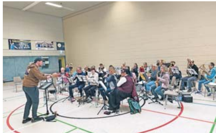
Proben für das Festwochenende.

Steinau. Die Stadtkapelle des Musikvereins Germania Steinau bereitet sich mit viel Engagement auf das große Festwochenende am 27. und 28. September vor. Die Proben laufen auf Hochtour, um sicherzustellen, dass alles perfekt wird. Mit dem ersten von zwei geplanten Probenwochenenden ist der Feinschliff in vollem Gange. Die Musiker arbeiten intensiv an ihren Stücken, um beim Fest eine großartige Vorstellung abzuliefern. Das Wochenende verspricht ein buntes Programm mit Musik, Spaß