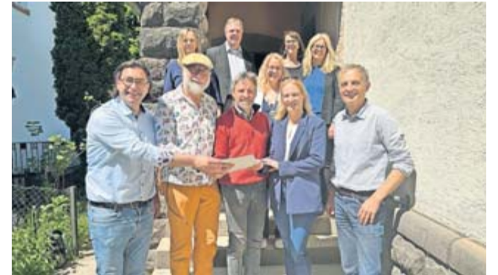
Die Übergabe der Baugenehmigung.

an Vertreter der evangelischen Kirchengemeinde teilnahm, sagte: „Friedberg geht mit diesem Projekt einen weiteren Schritt zum Ausbau der städtischen Kinderbetreuung. Wir freuen uns auf die diesbezügliche Zusammenarbeit mit der evangelischen Kirchengemeinde und der Regionalen Diakonie als Trägerin des künftigen Betreuungsangebots.“ Mit der Übergabe beginnen nun umfangreiche Umbau- und Sanierungsarbeiten im Gebäude. Künftig sollen im Erd- und Obergeschoss jeweils zwei Gruppenräume mit integriertem Schlafbereich für je fünf Kinder und einen Be-