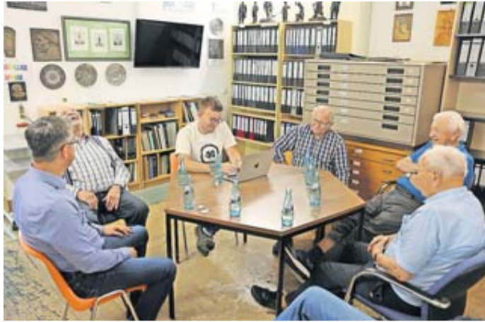
Das Energiemuseum Wölfersheim plant neue Dauerausstellung.

Die Geschichtsmannufaktur Kutzner unterstützt die Ehrenamtlichen und die Gemeinde Wölfersheim bei diesem Prozess. Das Unternehmen