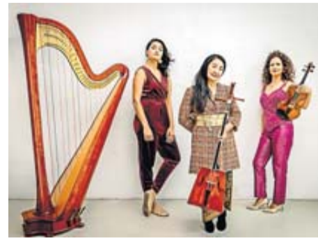
Das Ensemble Perismon.

Das Konzert am morgigen Sonntag, 22. Juni, beginnt um 16 Uhr im Großen Saal der Trinkkuranlage Bad Nauheim. Tickets gibt es ab 12 Euro im Vorverkauf, ermäßigt 10 Euro, online