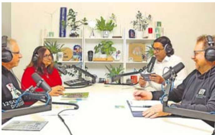
Ausschnitt aus der aktuellen Podcast-Folge mit Vertretern des Festausschusses.

Podcast-Folge beleuchtet 1250 Jahre Dorheim