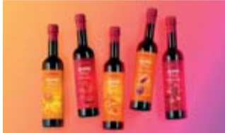
Mit WIBERG AcetoPlus wird jeder Salat zum Highlight.

Entdecken Sie die WIBERG Produkte im Onlineshop: www.shop.wiberg.eu Mit dem Code ACETOPLUS gibt es sogar bis 20.07.2025 15% Rabatt auf alle Produkte.