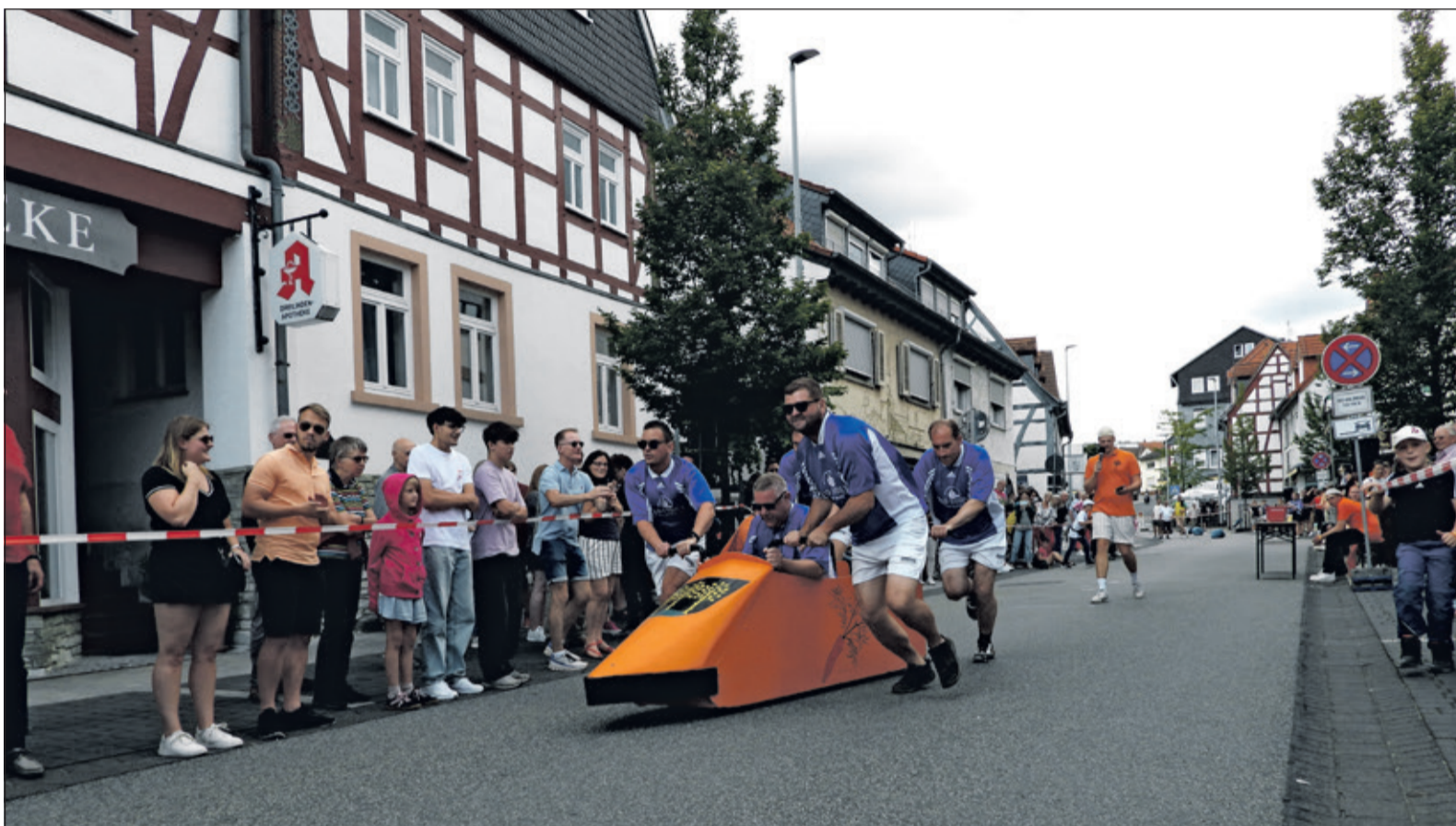
Das „Geeleriewerennen“ ist DAS Ereignis am Kerbewochenende und konnte seit langem endlich wieder stattfinden. Obwohl auch das Team „Rathausblitz“ alles gab, reichte es in diesem Jahr nur für Platz 2.

Neuenhain (nd) – Am vergangenen Wochenende fand in Neuenhain wieder die populäre Geeleriewekerb statt – eine der größten Kerben der Umgebung. Zahlreiche Besucher pilgerten zum Festplatz, um ein ausgelassenes Wochenende zu verbringen. Außer dem nahezu gigantischen Festzelt gab es zahlreiche Attraktionen, wie eine Schießbude, ein Kinderkarussell und einen großen Autoscooter. Auch kulinarisch hatte die Neuehaaner Kerb wieder einiges zu bieten. Neben dem leckeren Apfelwein der Apfelschmiede konnte man Allgäuer Büble Hefeweizen und diverse alkoholische und alkoholfreie Getränke genießen. Für eine gute Grundlage vor dem Alkoholgenuß sorgten leckeres Gyros, eine duftende vegetarische Pilzpfanne, knusprige Wildbratwurst und natürlich Bismarckheringsbrötchen – selbstverständlich alles zu humanen Preisen.