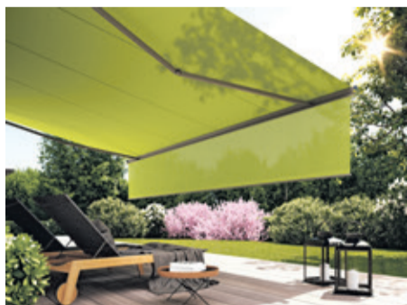
Hallo Schattenplatz: Elektrische markilux Designmarkisen lassen sich einfach per Knopfdruck oder Fingertipp bedienen.

(epr) Im Liegestuhl auf der Terrasse die frische Luft und die freie Zeit genießen – das macht gute Laune und entspannt. Bis die Sonne ein Stück weiter wandert und einem mitten ins Gesicht scheint. Dann heißt es aufstehen und die Markise kurbeln – es sei denn, man hat vorausschauend geplant und sich gleich für einen elektrischen Sonnenschutz