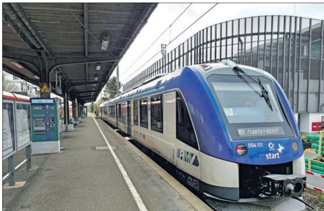
Bei der Regionaltangente West ist Geduld gefragt!

Ein zentrales Element des RTW-Projekts ist der Tunnelbau in Höchst. Um die Linie effizient durch das dicht besiedelte Gebiet zu führen, wird ein großer Tunnel unter dem Höchst-