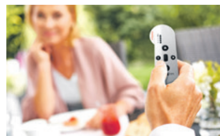
Mit dem Handsender können markilux Markisen bequem ein- und ausgefahren werden.

zu Hause ist und überraschend ein Unwetter aufzieht. Apropos nicht zu Hause: Natürlich lassen sich markilux Markisen mit io-Funkmotor auch ins Smart Home integrieren und per App mit Smartphone oder Tablet steuern – auch von unterwegs. Sogar die Lichtsteuerung ist per App möglich. Details zu den elektrischen markilux Markisen sowie Informationen zum Thema Nachrüstung gibt es beim markilux Fachpartner in der Nähe. Mehr auch unter www.markilux.com