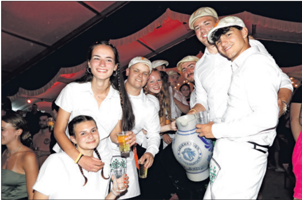
Die Neuenhainer Kerbeborsch und Petzküh' präsentierten stolz ihren Bembel in dem sich selbstgekelterter „Ebbelwoi“ befand.