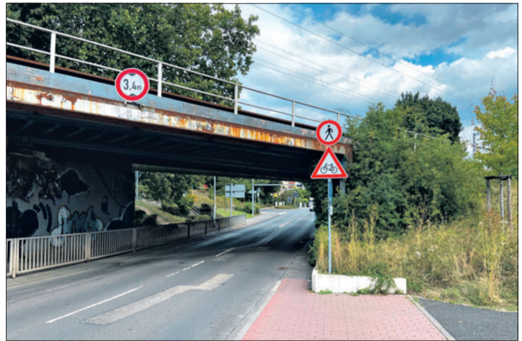
Zu eng und gefährlich: Die Unterführung auf der Sulzbacher Straße darf nur auf dem gesicherten Gehweg – hier links – erfolgen.