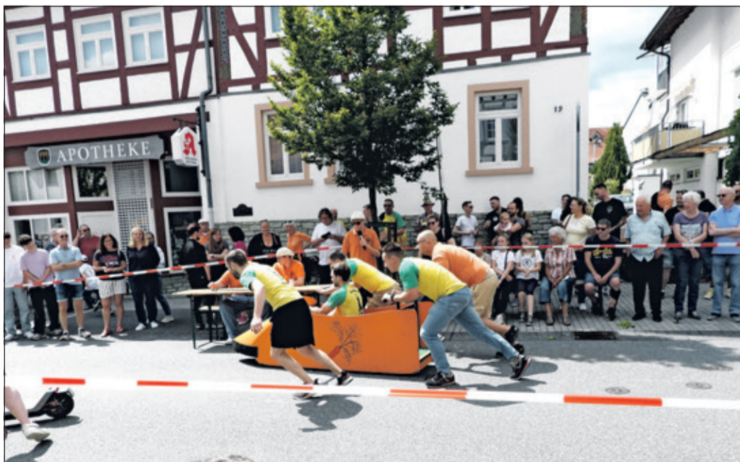
Das Team „Samba Mamba“ gab beim Geeleriewerennen alles und konnte sich den ersten Platz auf dem Treppchen sichern.

Zur großen Freude aller Beteiligten konnte zum ersten Mal seit langem wieder das Geeleriewerennen stattfinden. In den vergangenen Jahren hatte das Wetter dem Spektakel stets einen Strich durch die Rechnung gemacht. Zuletzt hatte das Rennen im Jahr 2022 stattgefunden. Doch dieses Mal war der Wet-