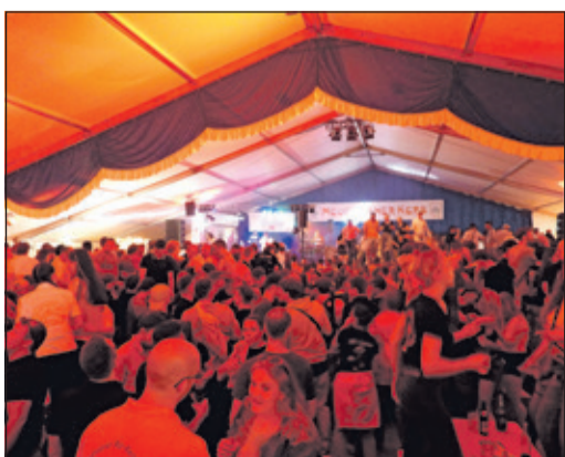
Das gigantische Kerbezelt war jeden Abend proppenvoll.