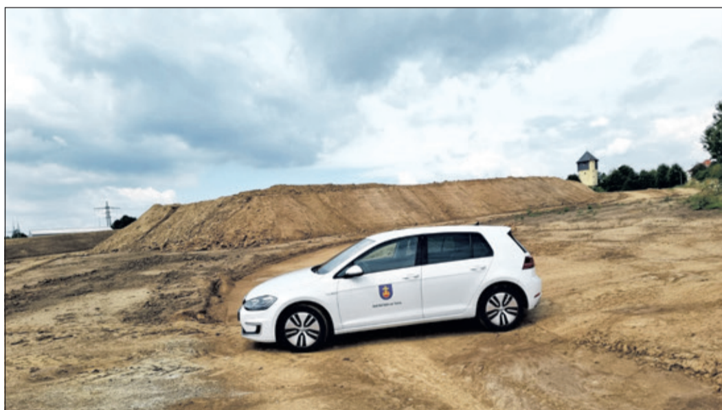
Im Baugebiet SINAI II+III geht es voran: Große Erdhügel zeugen von der laufenden Erschließung.

Bad Soden (bs) – Im Baugebiet Sinai II+III schreiten die Erschließungsarbeiten weiter planmäßig voran.