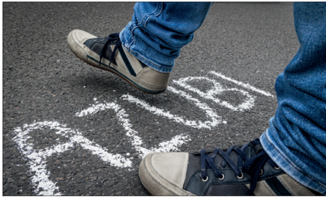
Als fitter und engagierter Azubi einen Schritt nach vorne machen: Junge Menschen haben die Chance auf ein Azubi-Stipendium.