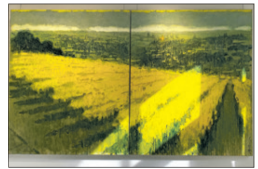
Blick vom Neroberg in Wiesbaden

Wer mehr über die Werke von Michael Apitz erfahren möchte, dem sei die Webseite apitz-gallery.com empfohlen.