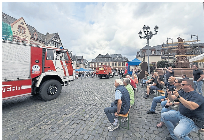
Oldtimer trifft Altstadt. Die Überfahrt der historischen Fahrzeuge stieß auf großes Interesse bei den zahlreichen Besucherinnen und Besuchern.

Zu den Höhepunkten der Ausstellung zählten unter anderem ein Mercedes Benz LAF 312 TLF 16 von 1955, einst im Dienst der Freiwilligen Feuerwehr Weilmünster, sowie ein Mercedes LF 8 aus dem Jahr 1968, heute im Pumpenmuseum der FF Stierstadt beheimatet. Auch ein seltener Daimler-Benz LLG, später als LF 8 klassifiziert und Baujahr 1942, war unter den Exponaten zu sehen – ein Fahr-