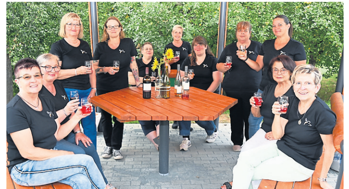
Der Ahäuser Landfrauenverein feiert sein 50-jähriges Bestehen im Rahmen des Weinfestes.

folgt der offizielle Fassbieranstich. Spiel und Spaß gibt's mit der Hüpfburg, dem Kinderschminken, einem Menschenkicker, Popcorn, Musik und Tanz und allerlei mehr.