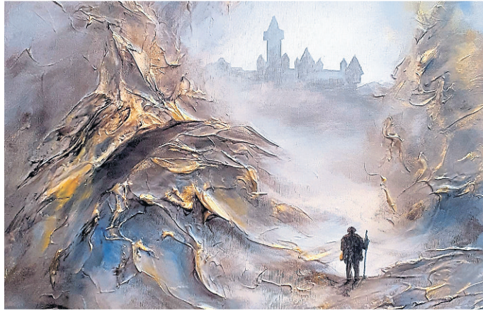
Ein traumhaftes Gemälde von Wolfgang Kissel. Foto: Kissel

Mauerstraße 4, 35781 Weilburg Telefon 06472 9166-16600