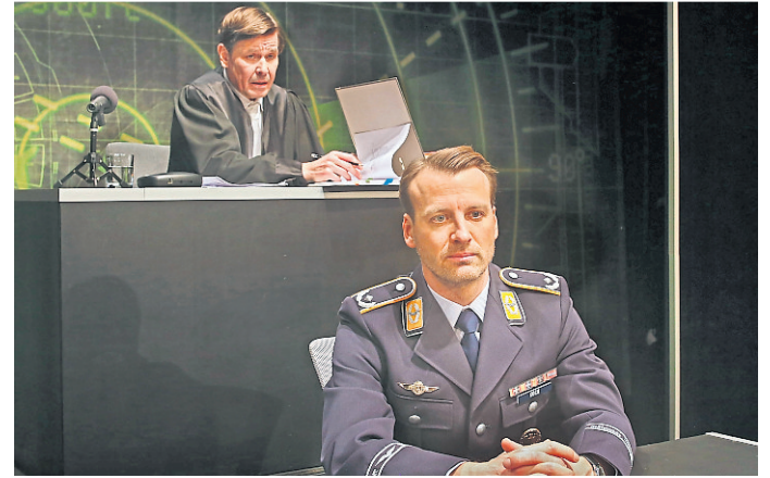
Szene aus dem Stück „Terror“.

Kontakt, Bestellungen für Abos und Karten: Theatergemeinde Weilburg e.V., Schlossplatz 1, 35781 Weilburg, Telefon 06471-9125409, E-Mail an theater@weilburg.de und im Internet unter www.weilburg-weilburg.de.