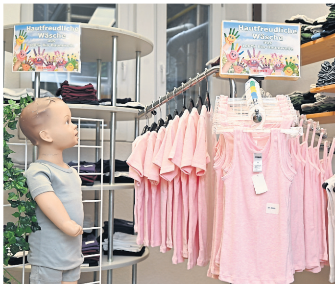
Kinderunterwäsche bei HERMKO.

Kontakt: HERMKO, Marktstraße 6, 35781 Weilburg, Telefon 06471-2195.