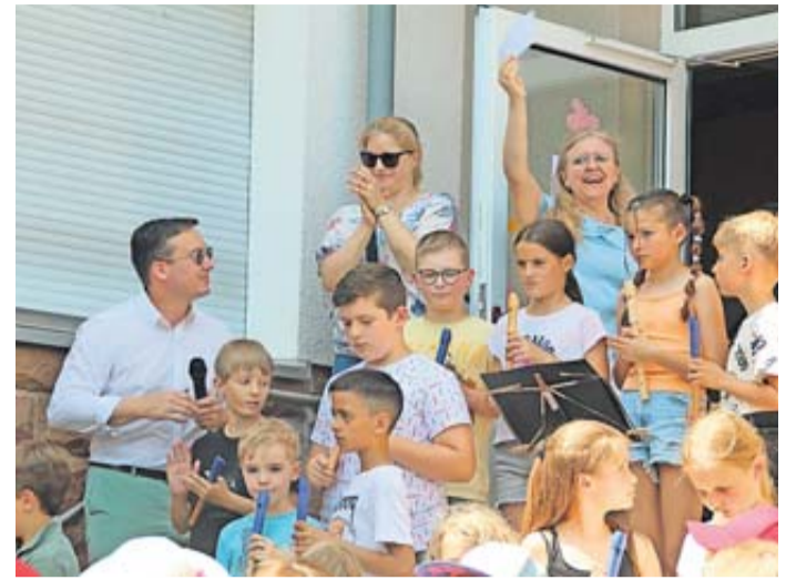
Eröffnung des Schulfestes.

Wie im letzten Jahr berichtet, organisierte die Schulgemeinde einen Spendenlauf, um das alte Spielgerät auf dem Schulhof zu ersetzen. Die Aktion brachte rund 10.000 Euro ein, was jedoch nicht ausreichte, um die Abriss- und Entsorgungskosten zu decken. Bürgermeister Möller hatte bereits im vergangenen Sommer Unterstützung zugesagt. Aufgrund von Witterungsbedingungen konnten die Arbeiten erst im Frühjahr beginnen. Die rechtzeitige Fertigstellung des Klettergerüsts zum Schulfest war daher mit