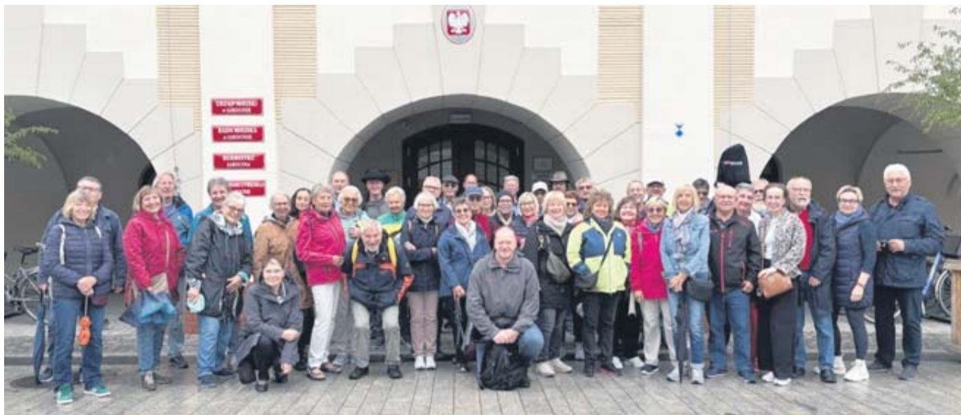
Die Reisegruppe vor dem Rathaus in Jarocin.

Schlüchtern. Eine 50-köpfige Reisegruppe des Fördervereins Städtepartnerschaft Schlüchtern-Jarocin brach zur 19. Begegnungsfahrt nach Polen auf. Ziel der einwöchigen Reise war ein tieferes Kennenlernen von Land, Kultur und Geschichte mit besonderem Fokus auf die Städte Warschau, Lodz und Jarocin. Bereits auf dem Weg legte die Gruppe einen ersten Zwischenstopp in Görlitz ein. Dort begeisterte ein Rundgang durch die eindrucksvoll restaurierte Altstadt mit ihrer einzigartigen architektonischen Vielfalt. In Warschau stand zunächst die Geschichte der Stadt nach dem Zweiten Weltkrieg im Mittelpunkt. Der Wiederaufbau nach 1945 – maßgeblich geprägt durch sowjetische Planungen – wurde greifbar bei der Besichtigung