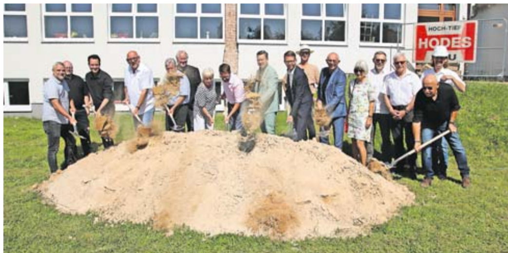
Beim offiziellen ersten Spatenstich für Sanierung und Umbau des Huttener Gemeinschafts- und Feuerwehrhauses waren zahlreiche Menschen in Aktion.

Umfassende Sanierung von Gemeinschafts- und Feuerwehrhaus abgeschlossen