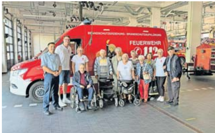
Besuch bei der Feuerwehr.

„Für unsere Gäste war es eine rundum gelungene Woche, in der sie nicht nur viel gelernt, sondern auch Freude an der