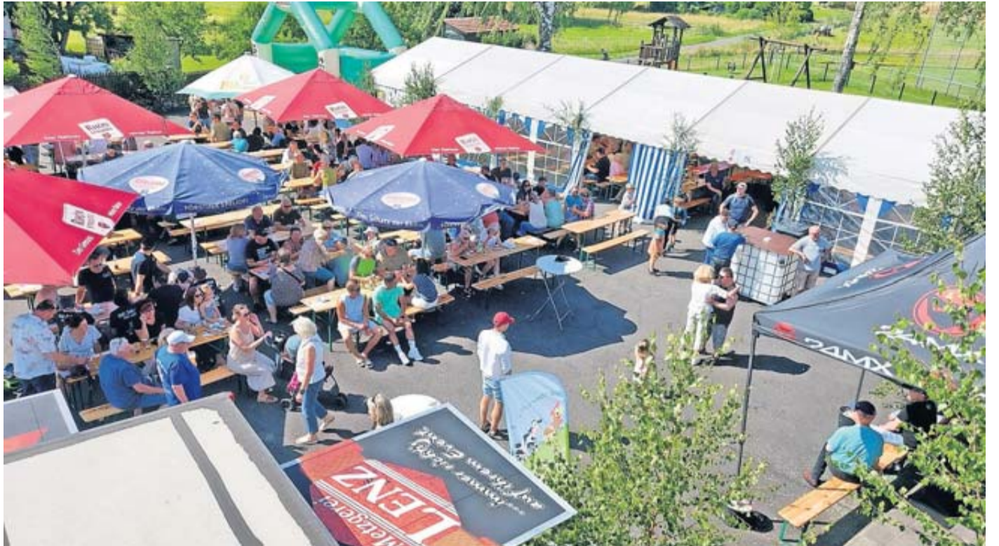
Gut besuchtes Backhausfest der Feuerwehr in Ahl

Freibier für alle. Neben Kaffee und Kuchen, dem Verkauf der raren original Ähler Backhausbrote – die letzten wurden zugunsten der Jugendfeuerwehr versteigert – und Hausmacher Wurst, gab es Eis vom Hof Sonnenberg. Die Landmetzgerei Lenz aus Schlüchtern bot Grillspezialitäten an und am „Bierschiffchen“ gab es gekühlte Getränke. Die Feuerwehr hatte neben Plätzen im Zelt auch ausreichend Festzeltgarnituren im Hof unter Sonnenschirmen aufgebaut, sodass jeder im Zelt, draußen unterm Schirm oder im Bürgerhaus Platz fand. Und für eine Hüpfburg für die Kleinen war auch noch genug Platz. Bis 22 Uhr ging das gemütliche Fest offiziell und wurde nur einmal um 12.30 Uhr kurz durch Sirenenalarm „gestört“ – ein Pkw hatte unmittelbar neben dem Hof angefangen zu brennen. Die Feuerwehr-Einsatzkräfte waren schneller als der Notruf, dämmten den Entstehungsbrand mit einem