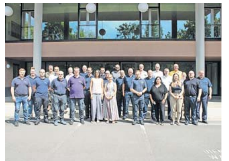
Das Wissen über Stabsarbeit verbessern und die Schnittstellen stärken: die Teilnehmenden an der jüngsten Schulung im Main-Kinzig-Forum.

sich in unterschiedlicher Zusammensetzung an Stabs- und Begleitpersonal. Dazu zählen Dezernenten, Amts- und Referatsleitungen aus Kreis- und Kommunalverwaltungen, Fachleute in kommunalen Verwaltungen und Verbänden sowie gesondert berufene beziehungsweise freiwillig gemeldete Beschäftigte. Die Workshops und Seminare sollen dafür sorgen, dass die Zusammenarbeit verschiedener Bereiche und Zuständiger im Main-Kinzig-Kreis für Krisen und Katastrophen gestärkt wird. Sie sollen zudem in den nächsten Monaten in einer größeren gemeinsamen Übung münden.