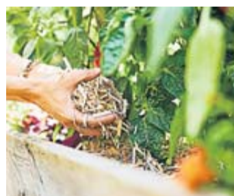
Sonnenschutz fürs Beet: Eine Mulchschicht schützt Erde und Pflanzen vor dem Austrocknen.

Die Sommer hierzulande werden tendenziell immer wärmer und trockener – eine Entwicklung, die Freizeitgärtner in ihrem eigenen grünen Reich hautnah beobachten können. Teils wochenlang anhaltende Dürre stellt sie vor neue Herausforderungen. Das Mulchen von Beeten und Hochbeeten ist eine weitverbreitete Möglichkeit, um Pflanzen besser vor einem Austrocknen zu bewahren. Doch worauf sollten Mulch-Anfänger dabei achten?