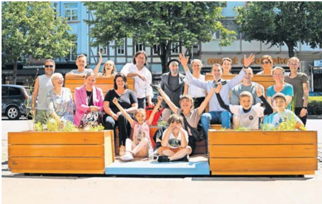
Friedberg belebt Innenstadt durch flexible Sitzgelegenheiten.

Mitmach-Projekt „Straßen neu entdecken“ gestartet