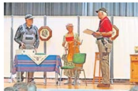
Die Seniorentheatergruppe zeigt neue Aufführung.

Beratungsstelle der Polizeistation Friedberg, deren Experten das Gezeigte kommentieren und wertvolle Ratschläge für richtiges Verhalten geben. Was tun, wenn Unbekannte an der Haustür klingeln oder man einen Schockanruf erhält? Die Expertinnen und Experten liefern die Antworten und stehen dem Publikum für Fragen zur Verfügung. „Prävention ist eine wichtige Aufgabe, der wir uns als Stadt gerne stellen“, betont Bürgermeister Steffen Maar. „Mit dieser Veranstaltung bieten wir unseren Seniorinnen und Senioren ein informatives und gleichzeitig unterhaltsames Angebot, um sich vor Betrug zu schützen. Die Kombination aus Theater und Expertenkommentaren ist ein besonders effektiver Weg, um das